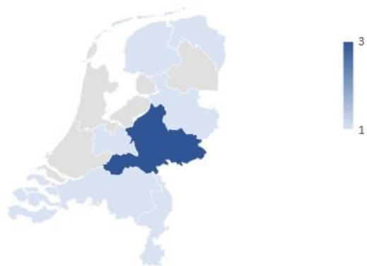
Figuur 2: Aantal convenanten per provincie