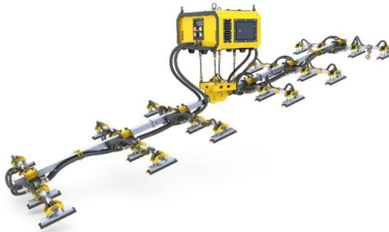
Figuur 2 De LEVO (Six pack lifter)

De techniek beoogt daarmee gevaren die gepaard gaan met het werkproces saneren op hoogte weg te nemen. In onderstaande figuur is de LEVO weergegeven voor een impressie: