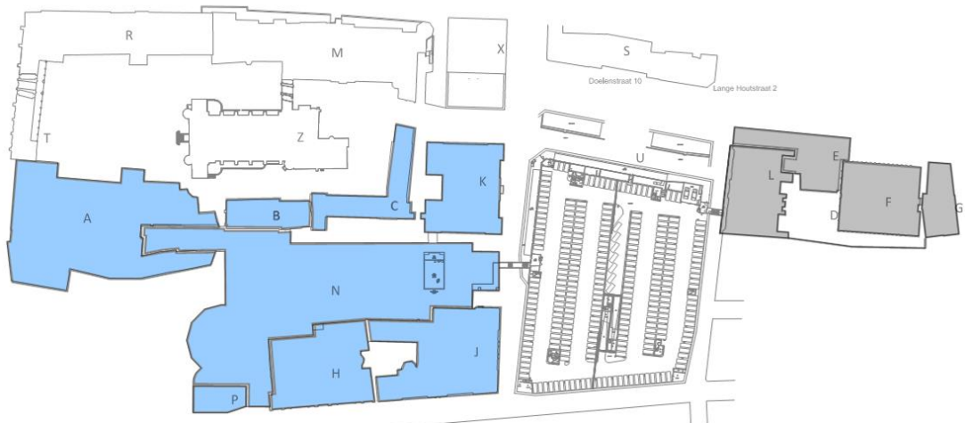
Fig. 1 – gebouwen Tweede kamer binnen scope (grijs is in scope, maar onderzoek is nog in bewerking)

Het onderzoek betreft de gebouwen Binnenhof 1a-7 (bouwdelen A, B en C), Koloniën (K), Justitie (J), Nieuwbouw (N), Perstoren (P), Logement (L), Lange Houtstraat(E), Depot (F) en Bleyenburg 7 (G). Het onderzoek voor de bouwdelen L, E, F en G is nog in bewerking en wordt later aan deze rapportage toegevoegd. Buiten de scope vallen de gebouwen aan de Doelenstraat, omdat dit een “huurobject betreft.