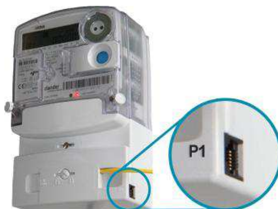
Afbeelding 2: voorbeeld consumentenpoort (P1-aansluiting) voor directe uitleesmogelijkheden

Consumenten die de ontwikkeling van het eigen elektriciteitsverbruik nog frequenter of zelfs in real time willen volgen, kunnen gebruik maken van de consumentenpoort (P1-poort) op de slimme meter (zie afbeelding 2). Via een op deze poort aangesloten energieverbruiksmanager ontvangt de consument real time informatie over de meterstand, voor elektriciteit is dit elke 10 seconden up-to-date en voor gas elk uur. 20 Daarom wordt feedback via deze consumentenpoort ook wel directe feedback genoemd.