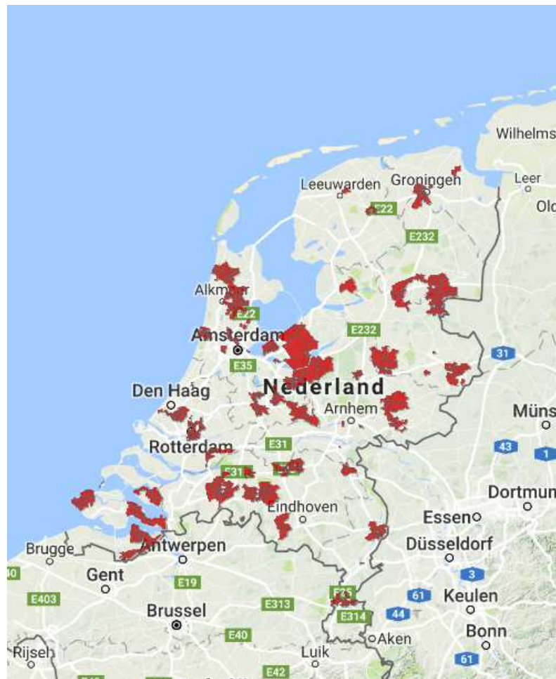
Abbeelding 1: Overzicht aanbiedingsgebieden slimme meter tot eind 2016

In de postcodegebieden waar in 2016 de slimme meter is uitgerold waren in totaal 23.290 huishoudens woonachtig die deel uitmaken van het onderzoekpanel voor de Consumentenmonitor. Hiervan hebben 2.466 huishoudens hun ervaringen desgevraagd teruggekoppeld nadat bij hen een slimme meter aangeboden was. Een netto-respons derhalve van ruim 10%.