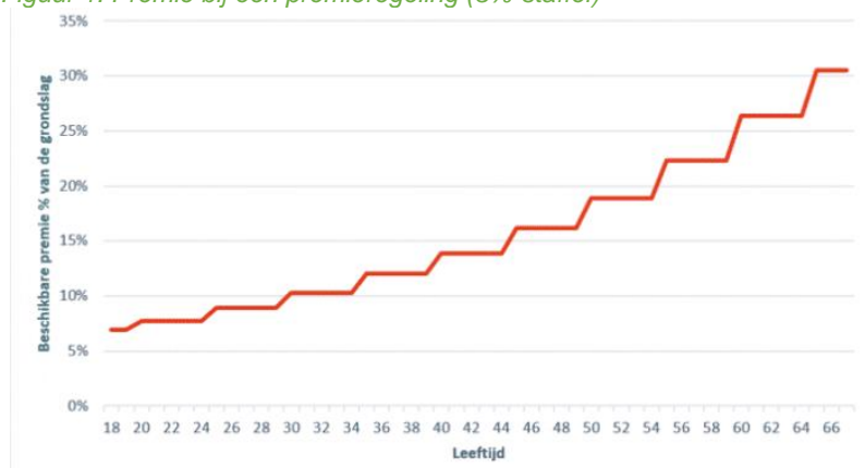
Figuur 1: Premie bij een premieregeling (3%-staffel)

In het pensioenakkoord is afgesproken dat voor alle regelingen een leeftijds on afhankelijk premie gaat gelden, dus ook voor pensioenregelingen die al geen doorsneesystematiek kenden. Daarmee worden ook de regelingen van verzekeraars en PPI's geraakt.