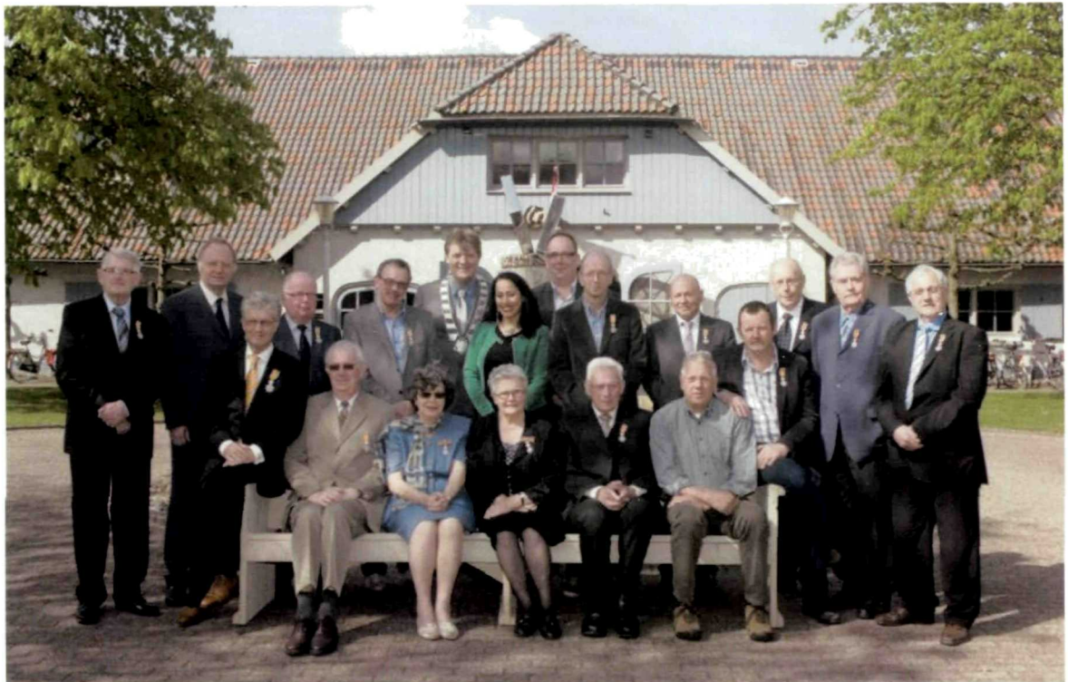
Uitreiking Lintjesregen 2013 – Heusden