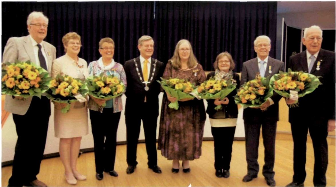
Uitreiking Lintjesregen 2013 – Zoetermeer

Met speciale dank aan het kabinet van de Gouverneur van Aruba, aan de gemeente Heusden, aan de gemeente Rotterdam, aan de gemeente Breda en aan de gemeente Zoetermeer voor het aanleveren van de foto's.