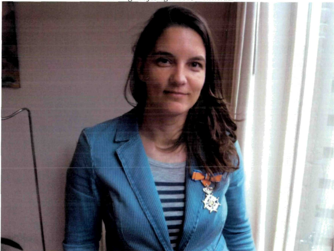
Uitreiking Lintjesregen 2013 – Breda