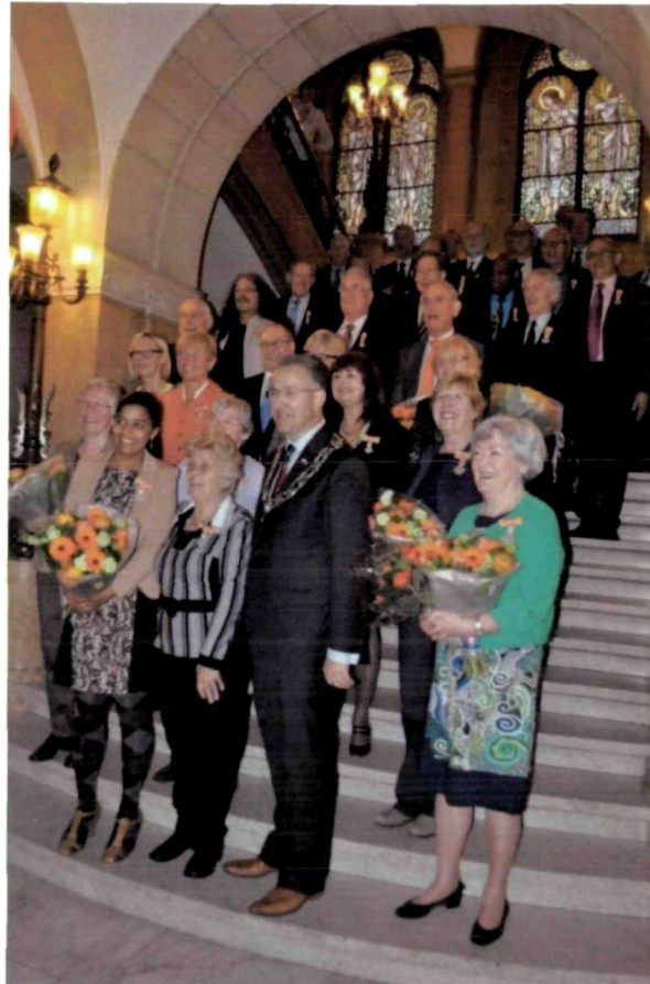
Uitreiking Lintjesregen 2013 – Rotterdam