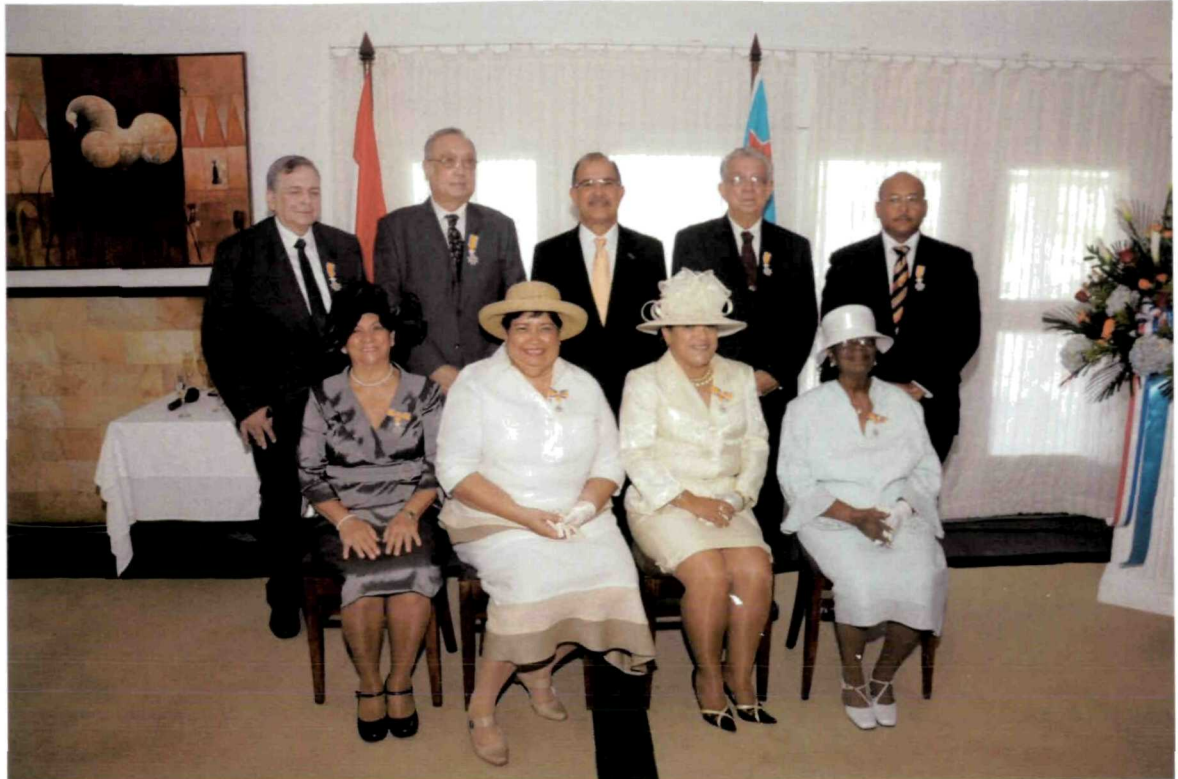
Uitreiking Lintjesregen 2013 – Aruba