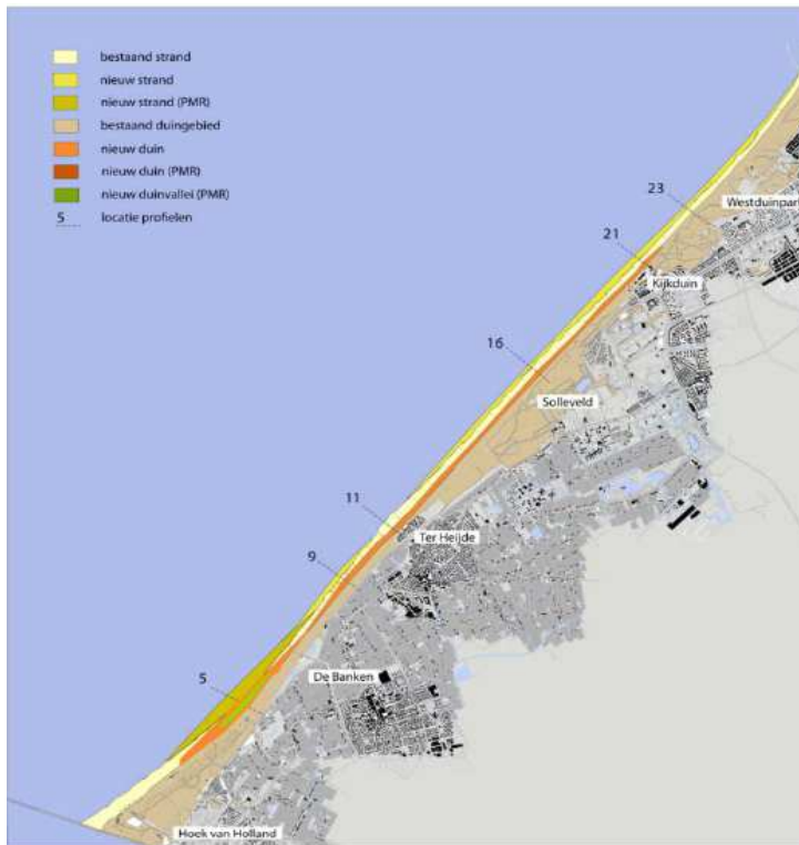
Figuur 1: Locatie duincompensatie Spanjaards Duin langs de Delflandse kust.