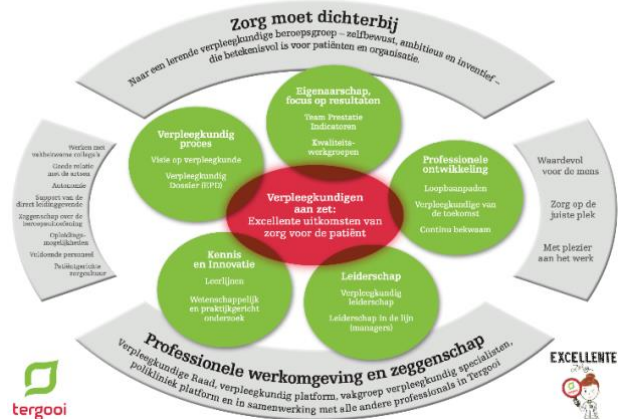
Professioneel Praktijk Model Verpleegkunde Tergooi

In Tergooi startten in 2016 de verpleegkundigen met een traject voor het verbeteren van de werkomgeving en professionele zeggenschap. Ter ondersteuning ontwikkelden zij het professionele praktijkmodel (figuur). Een nulmeting op basis van de pijlers Excellente zorg hielp de verpleegkundigen om te bepalen wat er nodig was om een sterke verpleegkundige organisatie neer te zetten. Een herhaalde meting in 2019 liet zien dat verbeteringen op alle Excellente zorg-pijlers zichtbaar was. Ook de komende jaren werkt Tergooi aan het versterken van de verpleegkundige organisatie en professionele zeggenschap, met elke drie jaar metingen zodat er inzicht is in de ontwikkelingen en waar nodig