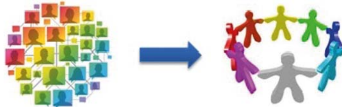
Figuur 1 – Van losse projecten naar partnerschappen

Voor de periode 2018 tot en met 2022 gaat het grootste deel van de begroting van het emancipatiebeleid naar 15 organisaties die in 8 partnerschappen samenwerken 5 . Het budget voor instellingssubsidies is vastgesteld op € 8 miljoen, waarmee er € 3 miljoen overblijft voor bijdragen aan medeoverheden en € 3,2 miljoen voor projectsubsidies. Ook is steeds meer ingezet op mainstreaming. Losse projecten en programma's worden alleen nog gefinancierd als deze bijdragen aan het realiseren van de voornoemde doelen en de uitkomst niet via de partnerschappen of mainstreaming kan worden bereikt.