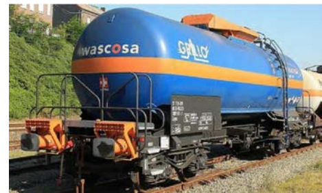
Figuur 1 voorbeeld van overbufferingbeveiliging (oranje) in combinatie met crashbuffers

De inspectie vindt het positief dat de chemiebedrijven: SABIC, OCI Nitrogen en AnQore in lijn met aanbeveling 2a geen operationele lastminutewijzigingen meer doorvoeren. In hun onderzoek naar de risicobeheersing van het vervoer van