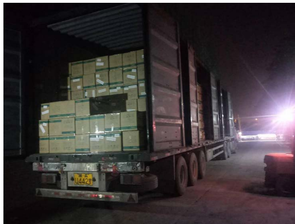
0,9 mln. FFP2 onderweg voor LCH