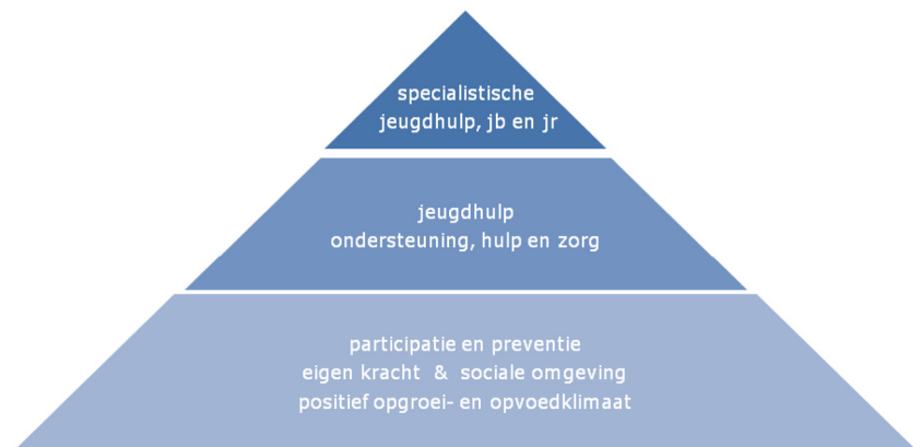
Figuur 2. Opbouw jeugdhulp, jeugdbescherming (jb) en jeugdreclassering (jr)

Figuur 2 geeft aan dat het voor het grootste gedeelte van de jeugdigen en hun ouders gaat om het bevorderen van een positief opvoed- en opgroei-klimaat, waar geen jeugdhulp nodig is. Een kleinere groep jeugdigen en hun ouders hebben ondersteuning nodig in de vorm van een voorziening. Slechts voor een zeer kleine groep jeugdigen en hun ouders er ingrijpen door de overheid noodzakelijk. Dit is het geval als ouders er onvoldoende in slagen om hun opvoedingsverantwoordelijkheid waar te maken en hun kinderen in de ontwikkeling worden bedreigd, of wanneer een jongere een strafbaar feit heeft gepleegd. Gesloten jeugdhulp, kinderschermingsmaatregelen en jeugdreclassering worden opgelegd door de rechter en uitgevoerd onder verantwoordelijkheid van en gefinancierd door de gemeenten.