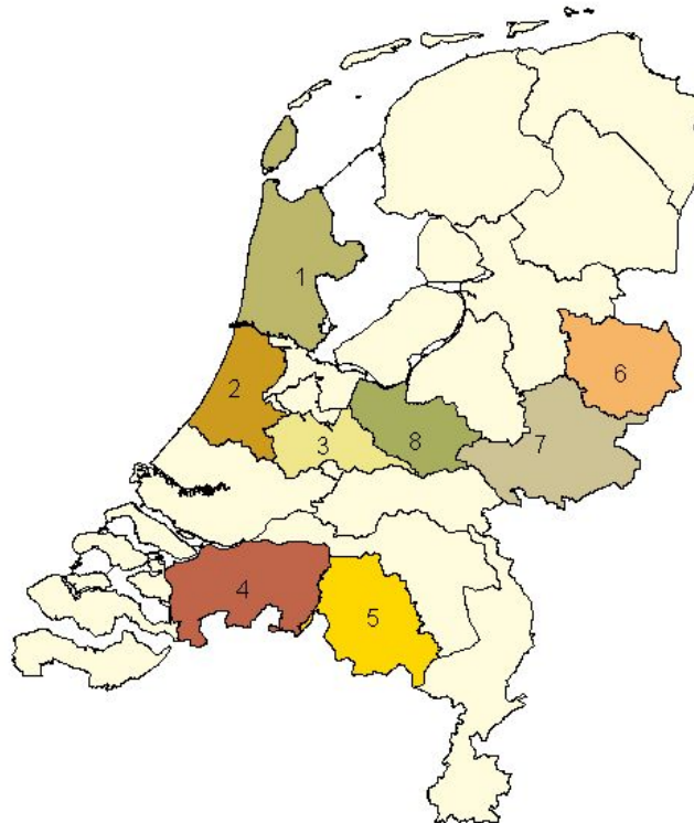
Kaart 1.1 Locaties geïnterviewde waterschappen

De gesprekken zijn gevoerd aan de hand van een vragenlijst. Deze vragenlijst (zie bijlage 3), is vooraf met de begeleidingscommissie afgestemd. Ter voorbereiding op de gesprekken zijn de websites van de waterschappen geraadpleegd. Deze staan achterin het rapport bij 'geraadpleegde literatuur en websites'.