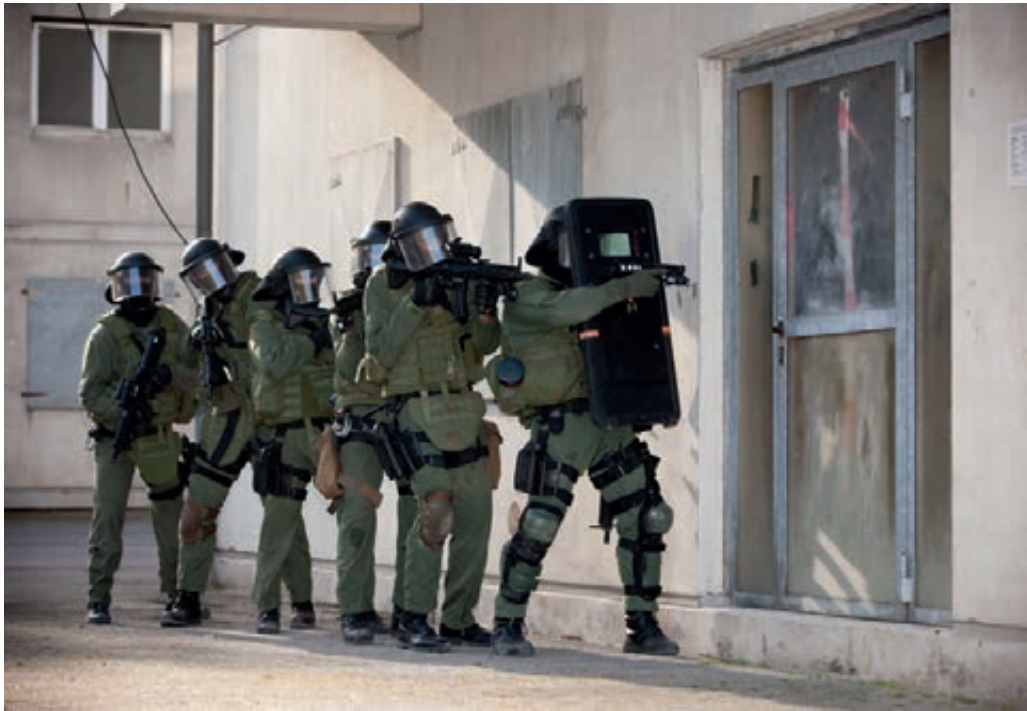
Interventie eenheid Korps Mariniers beoefent binnentreden object