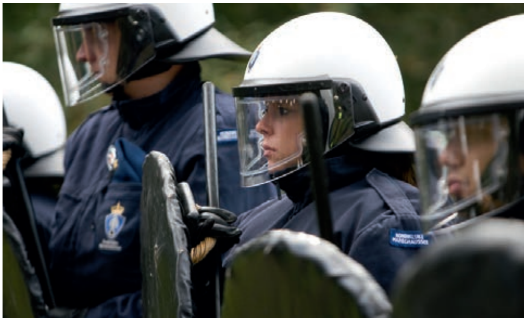
Koninklijke Marechaussee beoefent ME taken