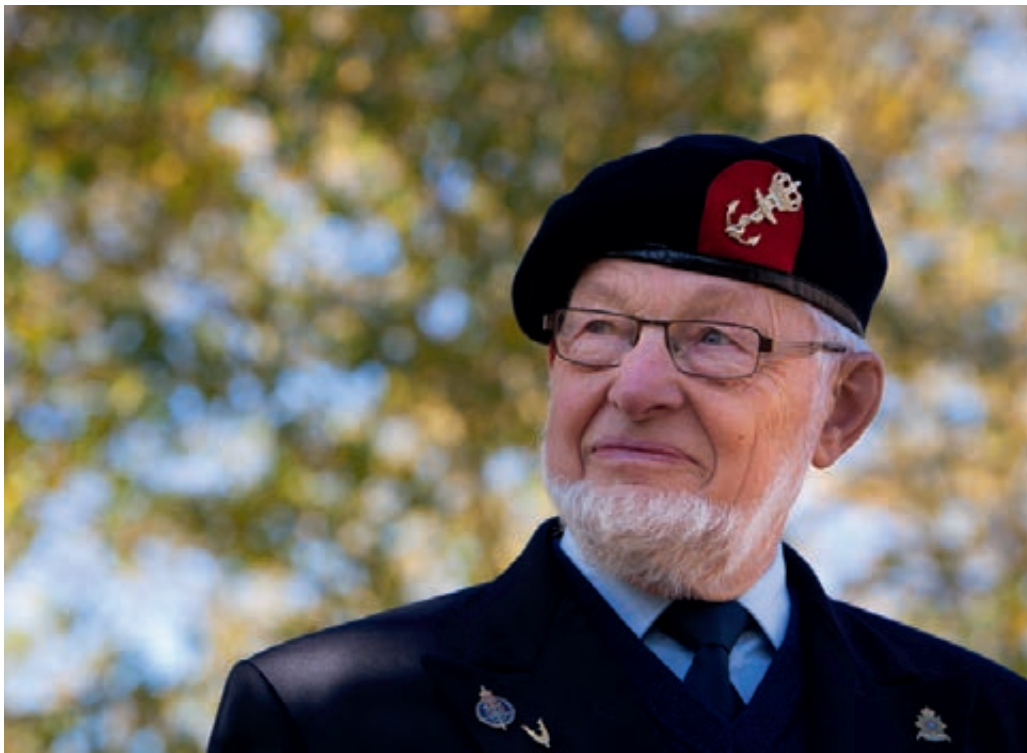
Reünie Nieuw-Guinea veteranen

Op het gebied van veteranen zijn in het verslagjaar significante positieve ontwikkelingen te melden. Zo is de Algemene Maatregel van Bestuur van de Veteranenwet uitgewerkt en het concept hiervan in december 2012 aan de bonden voorgelegd. De Minister van Defensie heeft medio 2012 een akkoord bereikt met de Centrales van Overheidspersoneel over de regeling Ereschuld Veteranen en in 2012 heeft de uitbetaling grotendeels plaatsgevonden. Vooruitlopend op de uitwerking van de Veteranenwet hebben actief dienende militairen die aan een missie hebben deelgenomen per 30 juni 2012 de status van veteraan gekregen.