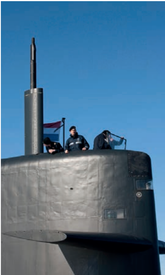
Hr.Ms. Bruinvis in Schotse wateren

bijgesteld en ook in 2012 is de nieuwbouw niet gerealiseerd. Het langdurig in gebruik houden van de gebouwen in Stroe leidt tot ARBO-technische problemen. Conform de huidige planning zou de nieuwbouw in 2015 gereed kunnen zijn.