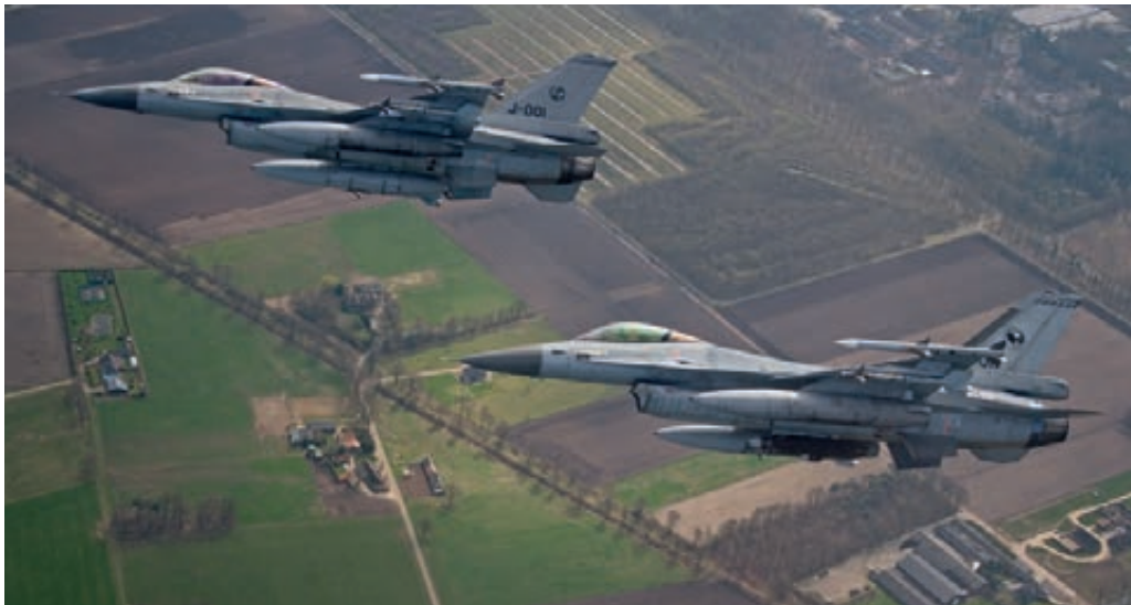
F-16 bij nationale inzet