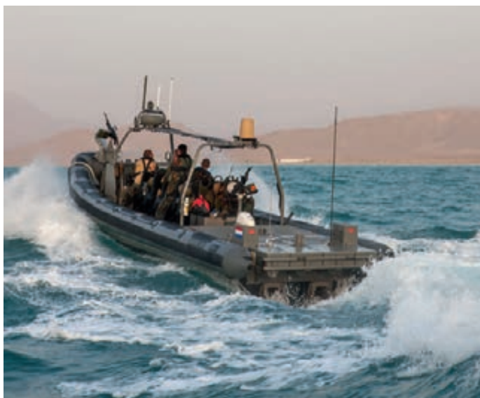
Optreden in Somalische wateren

De wens van burgerpersoneel aan een op hen toegespitst loopbaanbeleid, zoals werd aangegeven tijdens het bezoek aan de Hoofddirectie Financiën & Control en de Defensiestaf, is al geruime tijd bekend. Ook bij het bezoek aan de Defensie Bewakings- en Beveiligingsorganisatie, Regio Noord, maakte het jongere bewakingspersoneel het gemis aan een voor hen toepasselijk loopbaanbeleid kenbaar. Het oudere beveiligings-