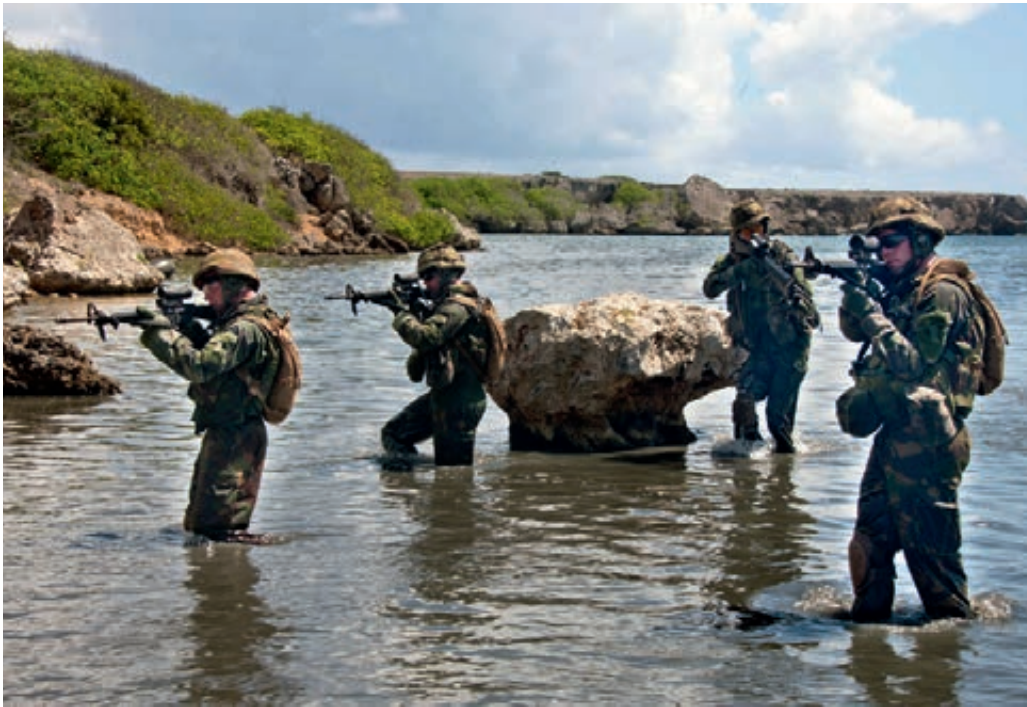
Compagnie in de West

voorziening, te weten een stimuleringspremie, een gegarandeerd maandelijks inkomen, een loonaanvulling bij vrijwillig ontslag of voorzieningen in verband met zelfstandig ondernemerschap. Per knelpuntcategorie is een maximaal quotum vastgesteld dat van de stimuleringsmaatregelen gebruik mag maken.