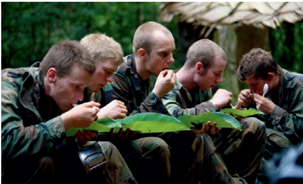
Jungletraining mariniers in Frans Guyana

Regelmatig is opgebracht dat bij materieelprojecten onderwijsleermiddelen niet worden opgenomen. Bij het Opleidings- en Trainingscentrum Logistiek van het Commando Landstrijdkrachten werd opgemerkt dat bij de invoer van de BOXER niet gegarandeerd is dat ook de geavanceerde onderwijsleermiddelen worden aangeschaft. Defensiematerieel heeft vaak onderdelen en systemen die civiel niet bestaan. Dan zijn specifieke onderwijsleermiddelen nodig om de kennis en vaardigheden aan te leren om het materieel in stand te kunnen blijven houden. In eerdere reorganisaties hebben geavanceerde onderwijsleermiddelen reducties van personeel en opleidingstijd mogelijk gemaakt en zonder deze middelen ontbreekt het aan voldoende tijd en capaciteit. Zo leidt de keuze geen onderwijsleermiddelen mee te nemen in het CV-90 project in de praktijk bij de invoer en het gebruik van het systeem tot veel problemen en gebruikersfouten. Het personeel van het Schietinstructie Controle & Coördinatieteam constateert bijvoorbeeld dat het ontbreken van exercitiemunitie de oorzaak is van onvoldoende geoefendheid op systeemprocedures bij de schutters en daardoor van onnodige gebruikersfouten op de schietbaan. De behoeftstelling voor aanschaf van exercitiemunitie 35 millimeter is inmiddels door de Defensie Materieel Organisatie in uitvoering genomen.