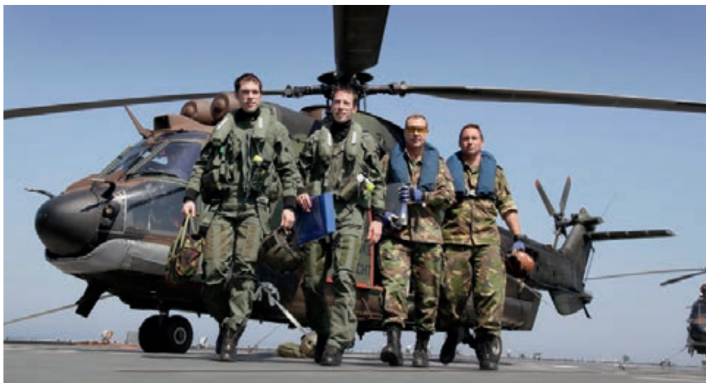
Deelname aan "Ocean Shield" op Hr.Ms. Rotterdam

In 2012 zijn voor de twaalf reorganisatietrajecten van het Commando Luchtstrijdkrachten afzonderlijke reorganisatieplannen opgesteld. Tevens is voor de Groep Luchtmacht Reservisten een extra reorganisatieplan tot stand gekomen. Bij alle activiteiten is continu aandacht besteed aan een constructieve samenwerking met en betrokkenheid van de medezeggenschap. Inmiddels heeft dit voor de Staf en de Kapel van het Commando Luchtstrijdkrachten geresulteerd in een Definitief Reorganisatieplan. De overige reorganisatieplannen zijn aangeboden aan de bonden ter behandeling of laatste besluitvorming. Daarnaast zijn diverse voorbereidingen getroffen voor een goed verloop van het personele vullingsproces en voor een beheerste transitie naar de nieuwe organisatie in de tijdspanne tot aan 1 januari 2016.