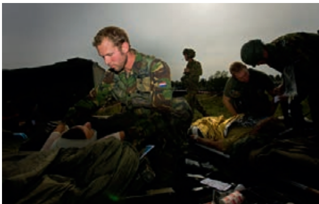
Oefening 'Peregrine Sword'

De militaire gezondheidszorg speelt een belangrijke rol bij de invulling van de eerstelijns gezondheidszorg. Tevens zijn er locaties waar 24 uur per dag medische zorg wordt verleend. Bij uitval van een zorgverlener was het zeer lastig tijdig een vervanging te regelen. De oorzaak lag onder andere in de procedures (Aanvraag tot behoeftstelling, verklaring van geen bezwaar) waardoor invulling van de behoefte maanden kon duren. In 2012 is een aanpassing van de verwervings- en aanbestedingsprocedure uitgevoerd waardoor vervanging sneller wordt gerealiseerd en geen maanden meer vergt. Verder wordt door onderlinge ondersteuning