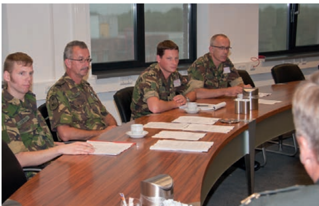
Medezeggenschapscommissie in gesprek met IGK

Door de hoge werklast ervaren leden van medezeggenschapscommissies minder mogelijkheden om cursussen en/of opleidingen te volgen. Voorts constateren zij dat door de toenemende werklast de bereikbaarheid van het lijnmanagement hen beschikbaar te stellen voor vergaderingen van de medezeggenschap afneemt.