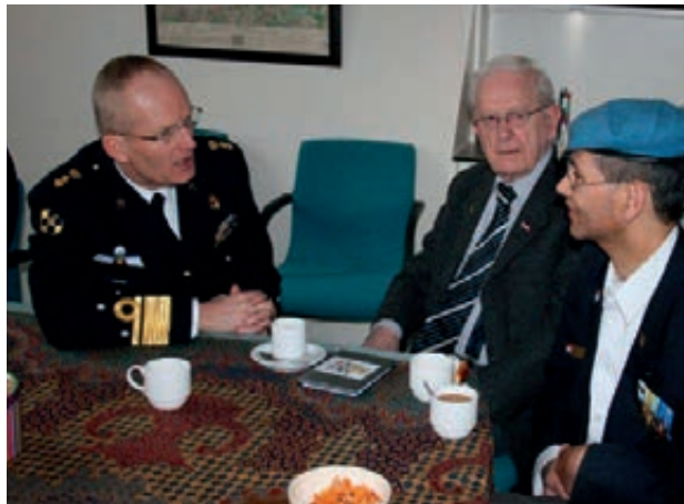
IGK in gesprek met veteranen

Als eerbetoon aan het thuisfront is in 1994 het 'zilveren roosje' bij de Koninklijke Landmacht geïntroduceerd. De uitgezonden militair krijgt bij terugkeer het roosje voor degene die voor hem of haar tijdens de missie het meest heeft betekend. Dit kleinood is sindsdien in een veel bredere omgeving uitgereikt aan uit missie teruggekeerde militairen. In juni van het verslagjaar heeft de Minister bekend gemaakt dat elke veteraan die het roosje niet eerder heeft ontvangen dit onder bepaalde voorwaarden alsnog kan aanvragen. Het Veteraneninstituut te Doorn draagt zorg voor het verwerken van de aanvragen en in de maand december 2012 is een aanvang gemaakt met de verzending van de zilverkleurige broches. Op dat moment waren bij het Veteraneninstituut al 1300 verzoeken ontvangen.