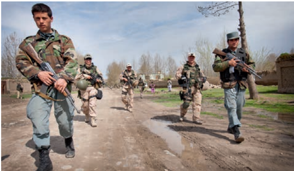
Gezamenlijke patrouille in Khanabad, Afghanistan

Op de trainingscentra van de NTM-A en het Duitse German Police Project Team vindt de initiële opleiding plaats voor het uitvoerend niveau van de Afghaanse politie. Voor deze basistraining worden instructeurs van de Koninklijke Marechaussee ingezet. De praktijktraining wordt verzorgd door multidisciplinaire teams, de zogenoemde Police Operational Mentor and Liaison Teams . De kern van deze teams bestaat uit een combinatie van marechaussees en militairen van andere krijgsmachtdelen.