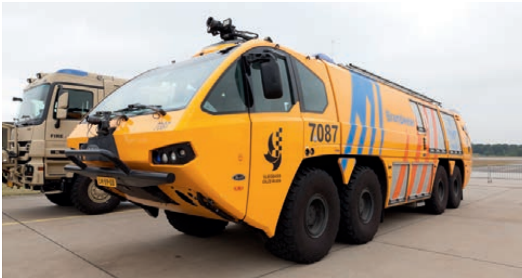
E-one blusvoertuig op vliegbasis Gilze-Rijen

Wekelijks worden reddingshelikopters van de luchtmacht ingezet om patiënten van de Waddeneilanden over te brengen naar een ziekenhuis op het vaste land. De reddingshelikopters worden tevens regelmatig gebruikt om personeel van de civiele scheepvaart en visserij in geval van medische noodzaak te evacueren naar het vasteland. Op termijn zullen de nieuwe NH-90 helikopters deze taken overnemen.