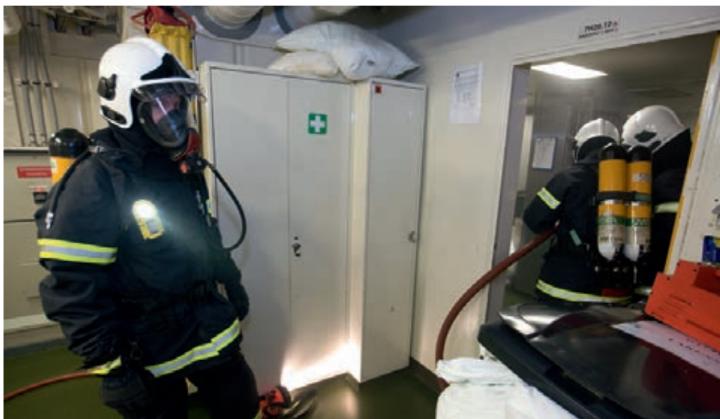
Brandweer beoefent blussen in kleine ruimten

In sommige vakgebieden is het aantal vacatures hoog. Voorbeelden hiervan zijn het technisch personeel bij het Commando Luchstrijdkrachten en het Commando Zeestrijdkrachten. Op de Koninklijke Militaire School Luchtmacht wijst men specifiek op het brandweerpersoneel. Een van de oorzaken voor het ontstaan van vacatures is dat het betreffende personeel geen toekomst ziet bij Defensie. Als speciaal gekwalificeerd personeel Defensie verlaat, is dit niet alleen een verlies van medewerkers waarin veel is geïnvesteerd, maar ook bestaat de zorg dat de veiligheid hierdoor op enig moment in het gedrang gaat komen. Kostbare kennis en ervaring gaan verloren.