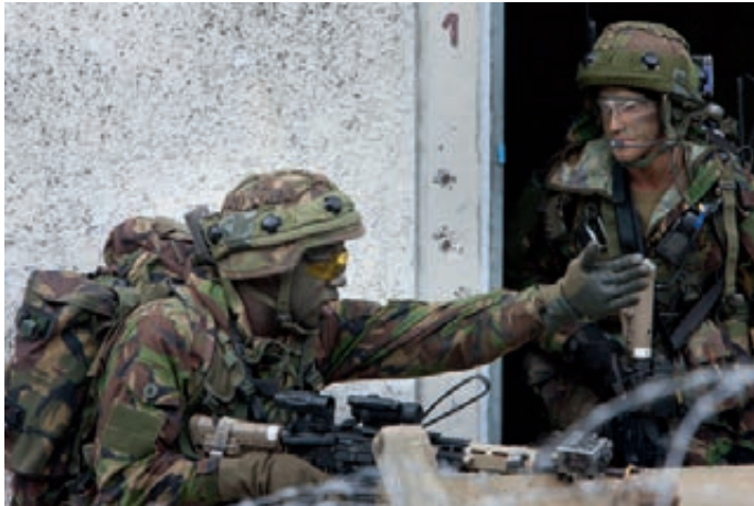
Oefening "Peregrine Sword"

over de instrumenten. De medewerkers hebben weinig vertrouwen in geautomatiseerde systemen en missen de persoonlijke begeleiding. In algemene zin is het personeel kritisch over het gehele reorganisatieproces. Specifiek gericht op het thema van dit onderzoek twijfelt het personeel defensiebreed of de ingezette P-instrumenten bijdragen aan de uiteindelijk gewenste kwalitatieve personeelsopbouw van Defensie.