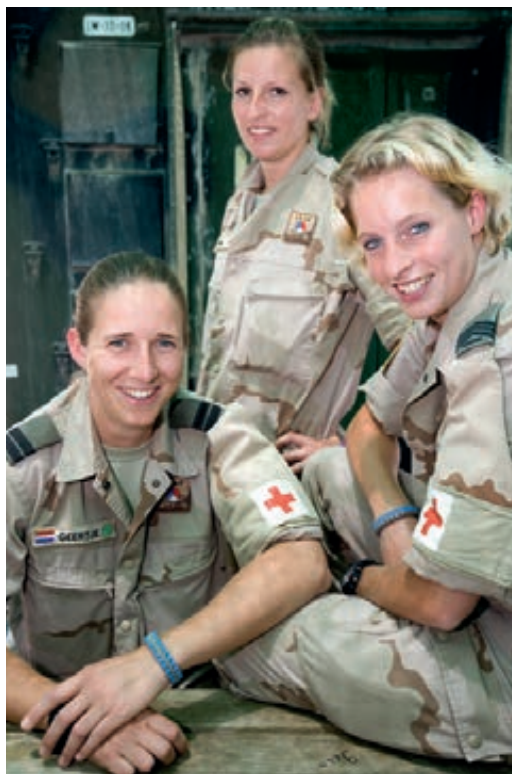
Medisch personeel van 1 (NLD) Deployment Element in Kunduz

In de periode tussen eind mei en begin juli van dit jaar hebben stafofficieren van de Inspecteur-Generaal der Krijgsmacht met 82 (aspirant-) officieren en onderofficieren behorende tot de Koninklijke Marine, Koninklijke Landmacht, Koninklijke Luchtmacht en Koninklijke Marechaussee gesprekken gevoerd over het onderzoeksthema. Daarnaast hebben ruim 75 onderofficieren en 15 officieren, ingedeeld bij de Koninklijke Marine, Landmacht en Marechaussee en behorende tot de doelgroep, een vragenlijst ingevuld. Stafofficieren van de Inspecteur-Generaal der Krijgsmacht zijn ook aanwezig geweest bij een door de Federatie van Nederlandse Officieren & Middelbaar en Hoger Burgerpersoneel georganiseerde themadag 'Ruimte voor jong talent' waaraan ongeveer 140 jonge officieren van alle krijgsmachtdelen hebben deelgenomen.