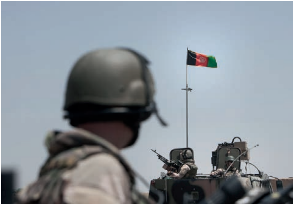
Inzet in Afghanistan

financiële voorzieningen en vormen van begeleiding opgenomen. De aanvragen van medewerkers om vrijwillig de dienst te verlaten uit de eerste tranche knelpuntcategorieën zijn gehonoreerd. Aangezien de vastgestelde quota in geen enkele categorie nog is bereikt, blijven de tranches knelpuntcategorie openstaan voor nieuwe aanvragen tot het vastgestelde quotum is bereikt.