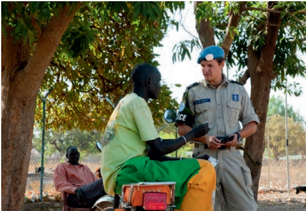
Inzet Koninklijke Marechaussee in Soedan

schaarse defensiecapaciteit, beperkt missierendement en veranderende beleidsprioriteiten is de militaire bijdrage per 1 februari 2012 beëindigd.