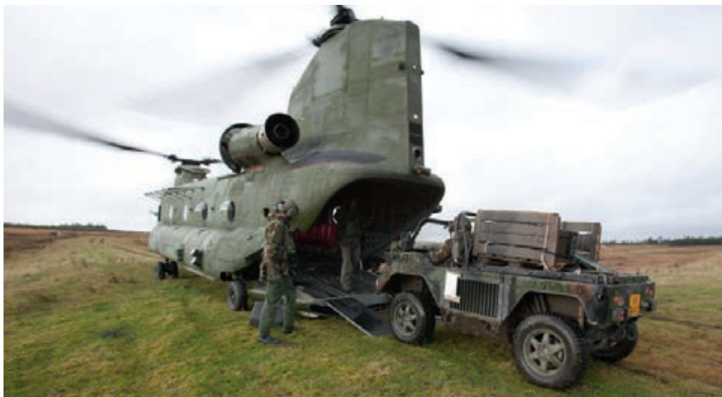
Verplaatsen luchtmobiele eenheid met Chinook, Carlisle UK

Net als in 2011 is de defensieorganisatie ook in 2012 geconfronteerd met een tekort aan middelen en achterstallig onderhoud. Dit is veroorzaakt door de voorheen geldende aanbestedingsstop en generiek genomen maatregelen op het gebied van materieel en infrastructuur. Ambitie en middelen staan door financiële tekorten op gespannen voet.