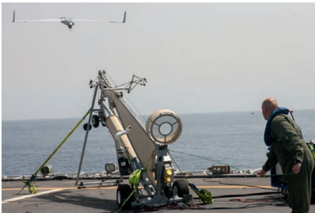
Lancering 'Scan Eagle' vanaf Hr.Ms. Rotterdam