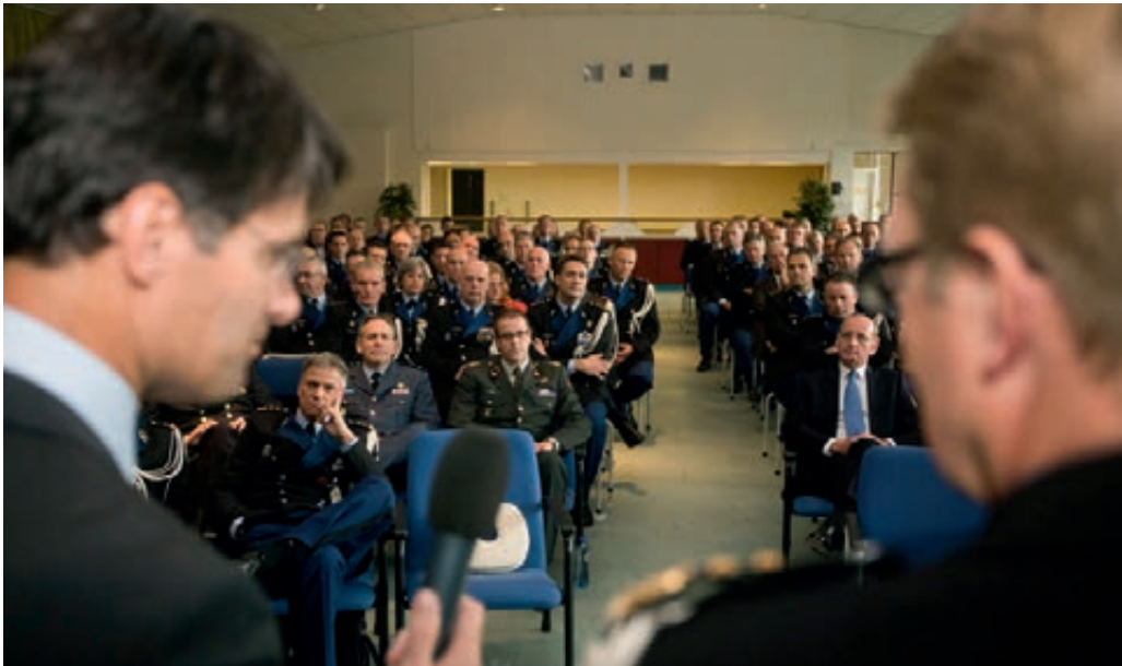
Marechausseeperoneel wordt bijgepraat op wapendag