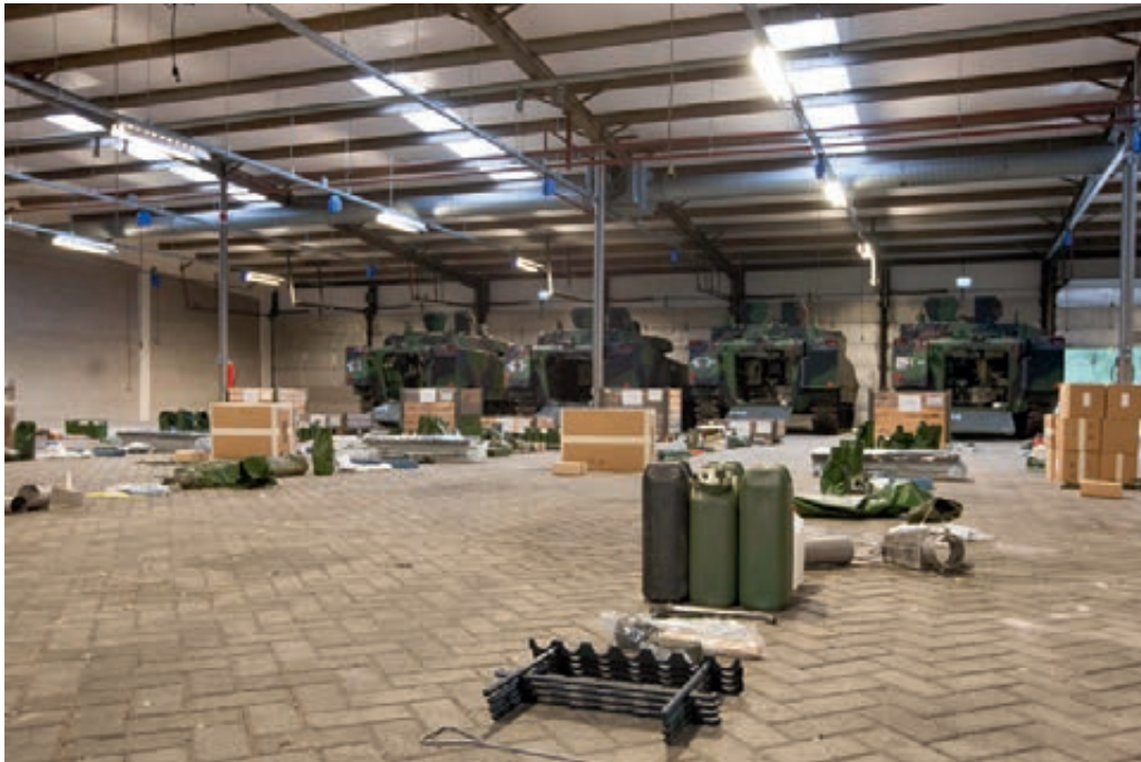
Uitgifte CV-90

bijgesteld naar realisatie in de tweede helft van 2013. Dan is door de reorganisatie het aantal monteurs echter teruggebracht. Het onderhoudspersoneel uit twijfels over de haalbaarheid van het voldoende inzetbaar houden van de CV-90, en daarmee aan het behalen van de operationele gereedheidstatus van 44 Pantser-infanteriebataljon in de eerste helft van 2013. Hun twijfel wordt versterkt doordat men constateert dat ervaren personeel de organisatie verlaat en de opleidingen voor nieuw personeel langdurig en zeer specialistisch zijn.