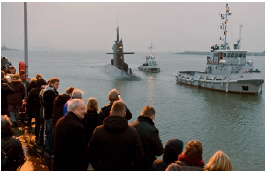
Thuiskomst van de onderzeeboot Hr.Ms. Bruinvis

De strakke en financieel gedreven kaders van de numerus fixus worden ervaren als een belemmering om de gewenste eindsituatie gecontroleerd te bereiken.