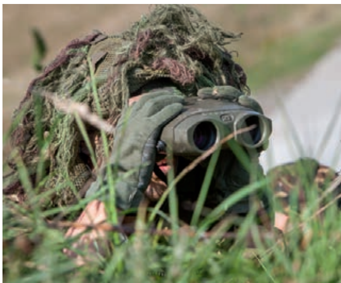
Spotter voor lange afstandschiutter

Het fenomeen generieke functiebeschrijvingen roept ook hier vraagtekens op. Men vindt de beschrijvingen te algemeen gesteld om duidelijkheid te geven wie wat moet gaan doen. Het is niet helder hoe de benodigde kwaliteiten voor een functie – de specialistische kennis en ervaring – worden geborgd en welke criteria worden gebruikt bij de selectie om de juiste man/vrouw op een functie te plaatsen. Hierbij wordt er op gewezen dat actuele informatie over het functioneren van personeel bijvoorbeeld in de vorm van beoordelingen, nauwelijks meer voorhanden is en men vraagt zich af 'hoe kan ik me onderscheiden?'. In dit kader wordt vaak het gemis genoemd van een personeelsbeheerder die zicht heeft op de kwaliteiten en wensen van het eigen personeel. Deze functionaris kan sturing geven aan de loopbaanbegeleiding door het behoud en verder uitbouwen van kennis en ervaring.