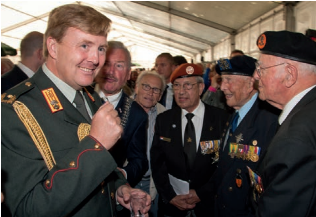
Veteranendag 2012