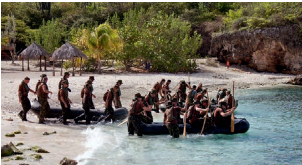
Compagnie in de West

Met het oog op de bezuinigingen wordt gezocht naar (inter)nationale samenwerking op het gebied van materieel. Er zijn bijvoorbeeld samenwerkingsverbanden aangegaan door Nederland en Duitsland op munitiegebied. Munitie en wapensystemen worden door het Defensie Munitie Bedrijf en zijn Duitse counterpart de Bundesamt für Wehrtechnik und Beschaffung gezamenlijk ingekocht, getest en opgeslagen. Daarnaast wordt door Defensie en BAE Systems, de producent van het infanteriegevechtsvoertuig, de CV-90, nauwer samengewerkt bij het onderhoud van de CV-90 door onder andere het uitwisselen van informatie.