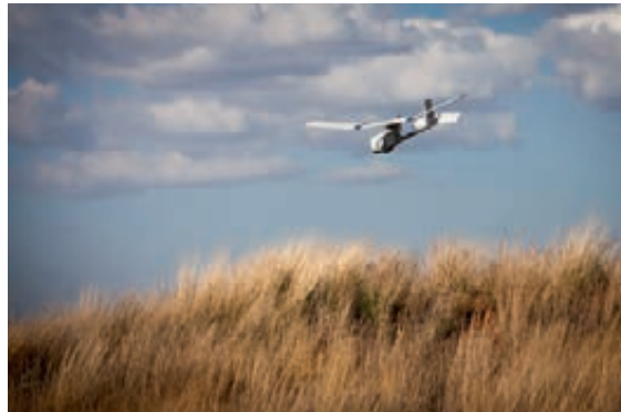
Onbemand verkenningsvliegtuig 'Raven'

De Raven wordt regelmatig ingezet voor het monitoren van mensenmassa's. Zo werden onbemande vliegtuigjes op verzoek van de politie in Groningen ingezet bij het grootste hardloopevenement van Noord-Nederland. Door de toeloop van meer dan 20.000 deelnemers en 100.000 bezoekers waren er risico's op het gebied van bereikbaarheid en verdrukking. De toestellen maakten luchtopnamen die de Groningse politie rechtstreeks in de commandopost kon bekijken. De Politie kon zich daardoor een goed totaalbeeld vormen van de mensenmassa.