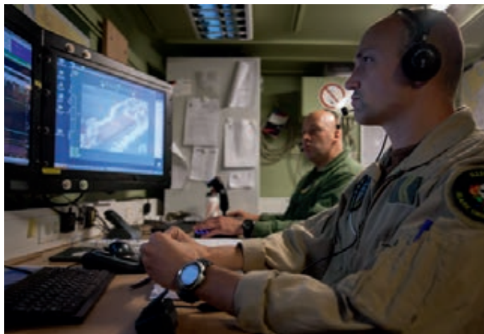
Bedienaars van 'Scan Eagle' aan het werk

Vanaf 2009 is het gebrek aan ICT-middelen ten behoeve van Nederlandse defensiemedewerkers in het buitenland aan de orde gesteld. In december 2011 is het DienstenCentrum Internationale Ondersteuning Defensie van start gegaan medewerkers in het buitenland te voorzien van een telestick. Hiermee kan een medewerker via het internet overal ter wereld op het MULAN netwerk komen en de administratieve en personeelssystemen benaderen. Het verkrijgen van de juiste defensiepas en pincode was