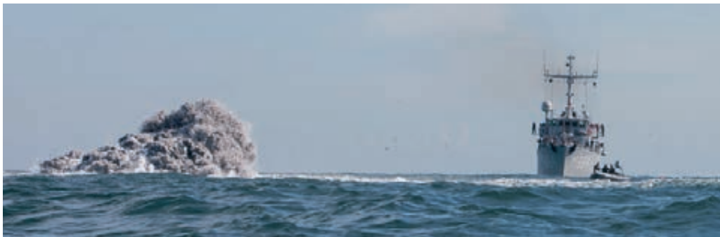
Marine ruimt explosieven op zee

Het overgrote deel van de reguliere inzet van het personeel van de Koninklijke Marechaussee vindt plaats op nationaal grondgebied. Naast de deelname aan vredesmissies en het uitvoeren van de politietaak voor Defensie, wordt het marechausseeperoneel dagelijks ingezet om haar brede civiele takenpakket te verrichten. Hieronder vallen bijvoorbeeld de beveiliging van de burgerluchtvaart en de politietaak op burgerluchtvaartterreinen, het mobiel grenstoezicht, objectbeveiliging, rechetaken, de beveiliging van waardetransporten van de Nederlandse Bank, ceremoniële diensten en persoonsbeveiliging voor het Koninklijk Huis, buitenlandse staatshoofden en politici en tevens assistentieverlening, bijstand en samenwerking met de regionale politie.