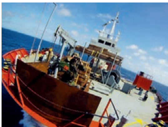
Beveiliging tegen piraten aan boord van koopvaardijship

Om zeer kwetsbare en grote Nederlandse zeetransporten te beschermen tegen Somalische piraten, zijn ook dit jaar Vessel Protection Detachments ingezet op de gevaarlijkste delen van de routes. Daarnaast beschermden Autonomous Vessel Protection Detachments van eind januari tot eind oktober 2012 de voedseltransporten van het World Food Program .