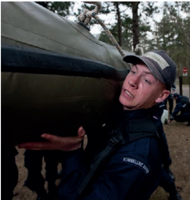
Matroos in initiële opleiding

Het kader van het Opleidingscentrum Initiële Opleidingen van het Commando Landstrijdkrachten maakt zich zorgen over de begeleiding van de instructeurs en de vorming van de leerlingen. Door de numerus fixus neemt het aantal senior instructeurs af. Als voorbeeld is gegeven dat binnen de schooleenheden van dit Commando per peloton het aantal ervaren instructeurs significant wordt teruggebracht. Het aantal leerlingen per groep zal groter worden, waardoor niet alleen de begeleiding van de collega instructeurs onder druk komt te staan, maar ook een uitholling wordt voorzien van het vormingsaspect bij de leerlingen. De kaderleden vrezen een wijziging van aanpak van begeleiding en vorming naar een leraarschap, met als gevolg verlies aan kwaliteit van de opleiding en daarmee ook van het opgeleide personeel.