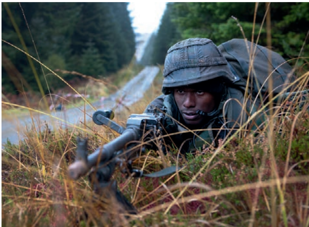
Training 2 e Mariniersbataljon

De opleidingen binnen Defensie staan onder druk om te worden ingekort; delen van de opleidingen worden geschrapt of overgeheveld naar de operationele eenheden. Bij bijna alle eenheden zijn hierover tijdens de werkbezoeken opmerkingen gemaakt. Regelmatig is ter discussie gesteld of alle taken goed belegd worden in de nieuwe organisatie en voldoende kennis en ervaring beschikbaar blijft. Men vreest voor verlies van kwaliteit in opleidingen en begeleiding, vooral op het gebied van de vorming. Er verdwijnt veel kennis en ervaring door het terugbrengen van de hogere onderofficiersfuncties waarmee de capaciteit voor zowel kennisoverdracht als begeleiding van jonge en minder ervaren instructeurs afneemt. Uiteindelijk is de vraag wat efficiënter is, het steeds opnieuw opleiden van onervaren mensen of het – bij gebleken geschiktheid – langer gebruiken van de opgebouwde kennis.