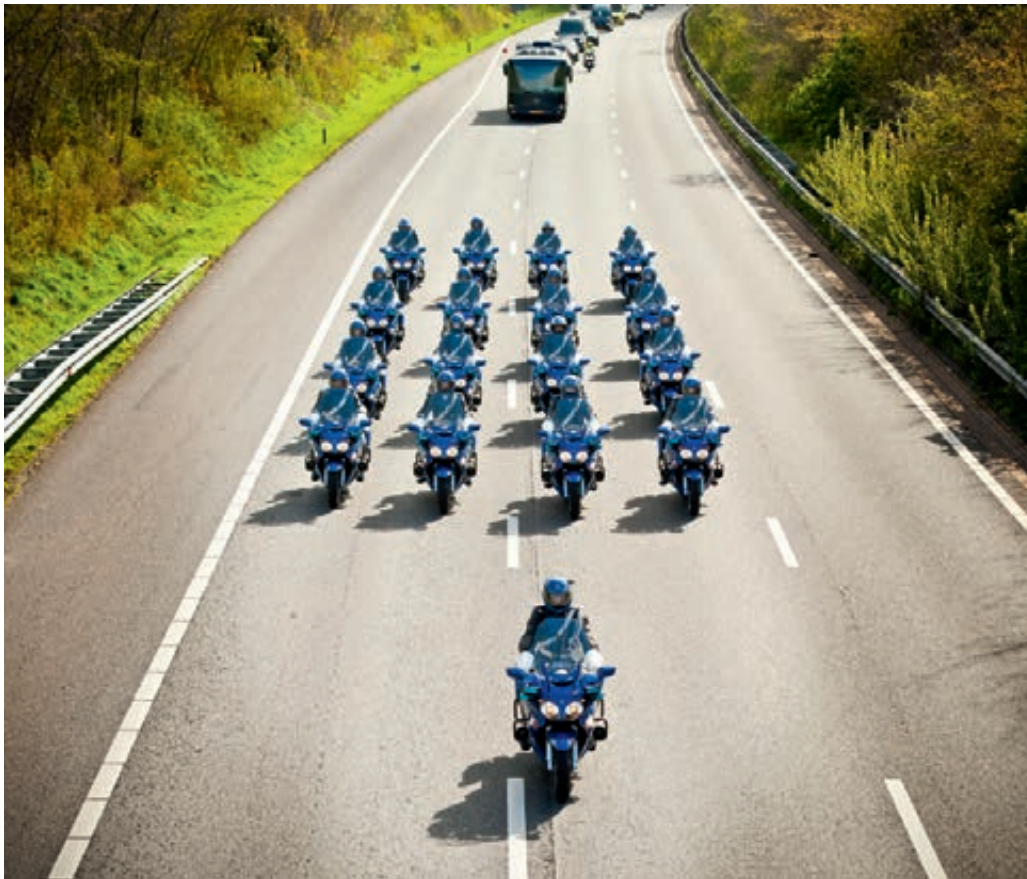
Ere-escorte van de Koninklijke Marechaussee

Lijncommandanten en teamleiders van de Koninklijke Marechaussee geven aan een behoefte te onderkennen aan training en opleiding voor nieuwe leidinggevendenden op het gebied van personeelszaken, zoals kennis over rechtspositie, personeelszorg, Wet Poortwachter en Peoplesoft. Burgermedewerkers van de Koninklijke Marechaussee op leidinggevende posities spreken de wens uit opleidingen te mogen volgen op het gebied van leidinggeven.