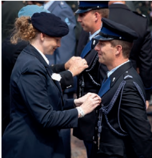
Medaille-uitreiking door post-actieve veteranen aan actief dienende veteranen

voor veteranen en hun relaties, waardoor ook de informatievoorziening hierover wordt verbeterd. Op welke wijze internet en social media daarbij worden ingezet, is nog onderwerp van uitwerking. Achter het loket wordt de zorgverlening in processen en procedures meer gecoördineerd, waardoor de zorgvrager zich hier minder in hoeft te verdiepen. De militair en zijn relaties worden na terugkeer van uitzending intensief en proactief begeleid. De mogelijkheid een burgerhuisarts te informeren over de status van de veteraan na dienstverlating is geregeld met de DMG aanwijzing: “Overdracht geneeskundige zorg bij dienstverlating”. De voorgestelde actieve begeleiding van dienstverlaters en hun partners door informatievoorziening en training wordt vormgegeven door het Vormingscentrum Beukbergen.