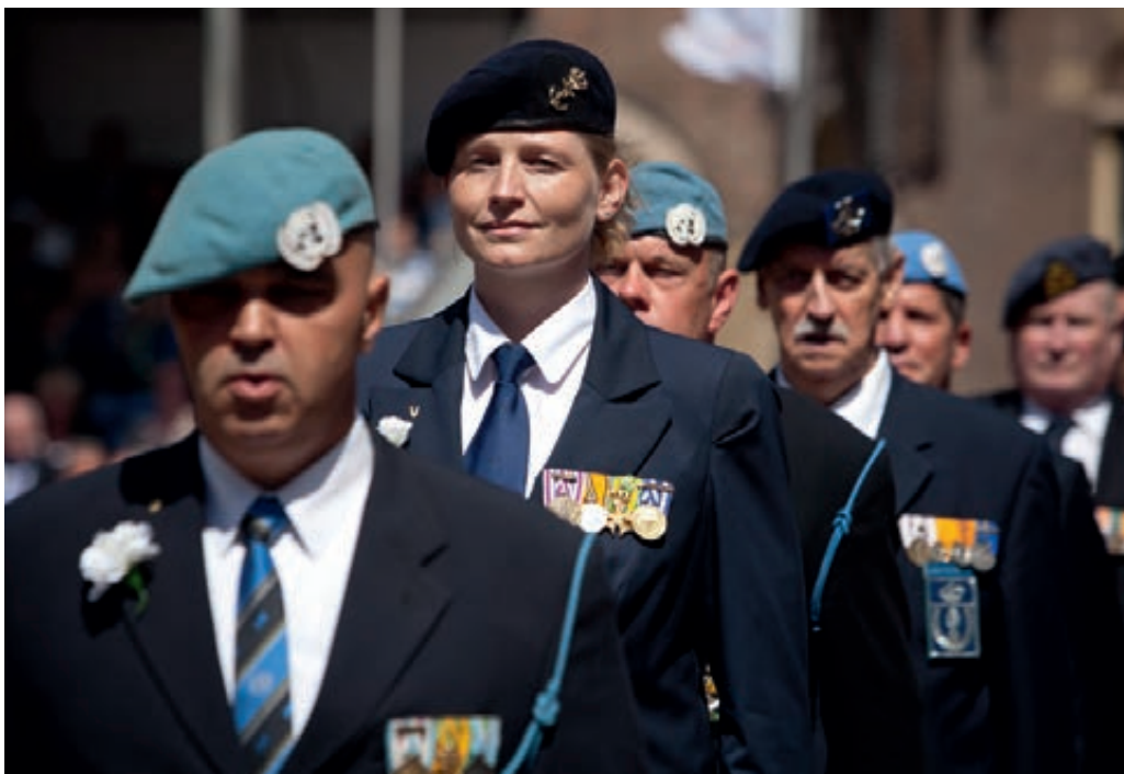
Diverse veteranen defileren op de Nederlandse veteranendag

Net als vorig jaar zijn ook in dit verslagjaar door privé initiatieven nieuwe veteranenontmoetingscentra of inloophuizen geopend waar veteranen elkaar in de buurt kunnen treffen in een veelal huiselijke omgeving. Meestal wordt op deze locaties periodiek ook steun geboden vanuit het Veteraneninstituut, Stichting de Basis en het Dienstencentrum Bedrijfsmaatschappelijk Werk. Een punt van zorg is de levensvatbaarheid van deze ontmoetingscentra. In 2012 is door de Hoofddirecteur Personeel een bedrag beschikbaar gesteld om de inloophuizen te ondersteunen en de zogenoemde nuldelijnszorg te borgen. Voorts is vanuit Defensie capaciteit beschikbaar gesteld om via een werkverband voor deze centra een goede uitgangspositie te creëren. Het Nationaal Fonds voor Vrede, Vrijheid en Veteranenzorg heeft met ingang van 2013 een subsidie toegezegd voor de periode tot 2016. Deze subsidie wordt beheerd door het Veteranenplatform en is erop gericht de centra onderling te verbinden, de nuldelijnszorg te verankeren en financiële zelfredzaamheid te bewerkstelligen.