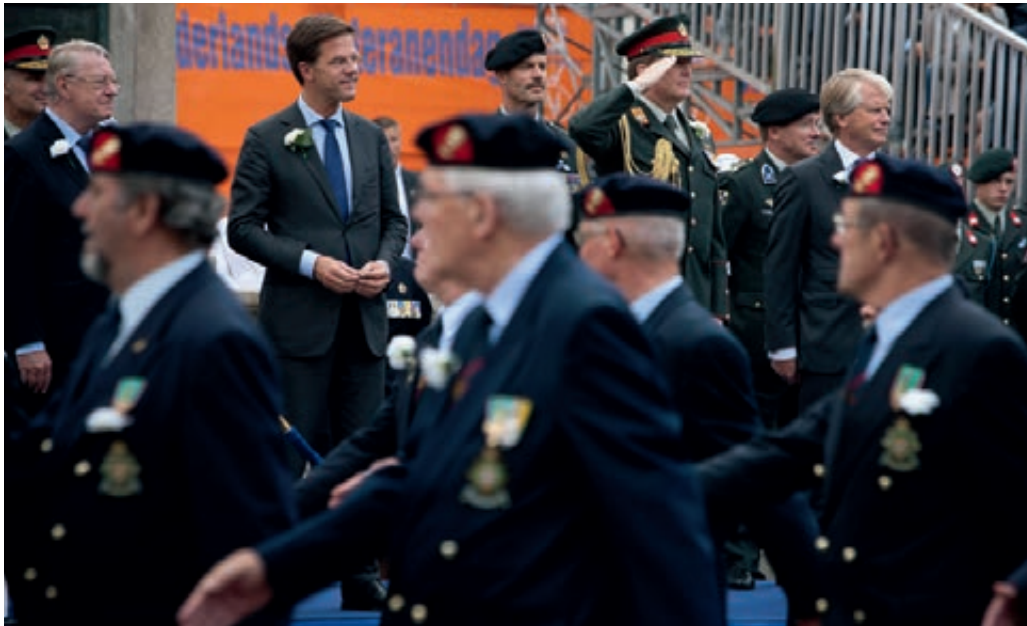
ZKH Prins Willem-Alexander neemt het defilé af tijdens de Nederlandse veteranendag

in de opmaak voor de jubileumversie van de Veteranendag in 2014, kwalitatief te blijven verbeteren en streeft ook naar bredere verslaggeving van deze dag, dan de beperkte uitzending van het defilé.