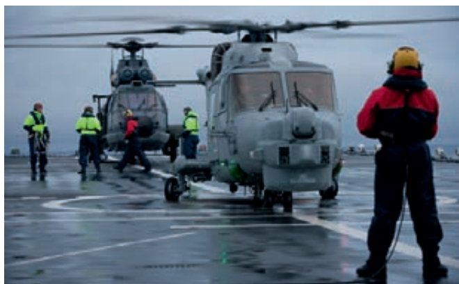
Helikopterinzet tijdens oefening "Cold Response"

Tijdens het werkbezoek in maart 2012 aan Nederlandse troepen in Afghanistan gaf het personeel aan dat de verstekte kledingpakketten onvoldoende beschermen tegen de kou gedurende de winterperiode. Naar aanleiding van deze signalen is een aanpassing op het kledingpakket ten behoeve van winterrotaties Afghanistan gerealiseerd. Op dit moment zijn de uitgezonden militairen in Afghanistan in het bezit van een adequaat winterkledingpakket.