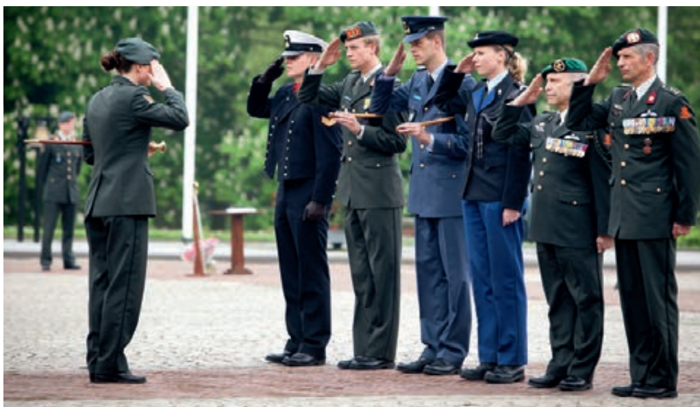
Commando-overdracht Nederlandse Defensie Academie

Eén van de gevolgen van de reorganisatie is dat eenheden worden samengevoegd. Dit gebeurt ook krijgsmachtdeeloverschrijdend. Binnen joint eenheden werkt personeel van verschillende krijgsmachtdelen samen; het onderdeel wordt door één krijgsmachtdeel aangestuurd. Personeel van andere krijgsmachtdelen binnen die joint eenheden signaleert steeds vaker dat de binding met het eigen Operationeel Commando afneemt. Als gevolg hiervan vreest men voor een afname van de carrièremogelijkheden in het eigen vakgebied of is men bezorgd dat het moeilijk wordt terug te keren – in een ander vakgebied – binnen het eigen krijgsmachtdeel.