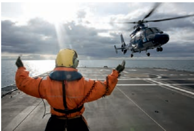
De vliegdecoffier van Hr.Ms. Evertsen gidst een helikopter

Het vaststellen van knelpunt categorieën heeft niet bijgedragen tot het gewenste doel: stimuleren van de vrijwillige uitstroom van personeel. In die zin is de meerwaarde van dit instrument te verwaarlozen. Het schept wel duidelijkheid naar de organisatie, maar geen duidelijkheid naar de individuele medewerker. De afkondiging van knelpuntcategorieën heeft veel onrust onder het personeel veroorzaakt.