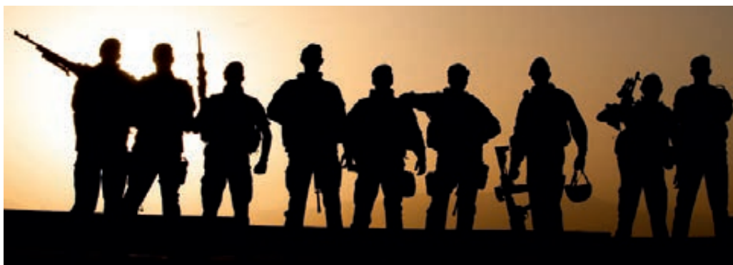
Force protection Korps Mariniers

Het sociaal beleidskader wordt door alle Defensieonderdelen ervaren als een instrument waar nog weinig animo voor is. Daar waar de onduidelijkheid over de numerus fixus en/of knelpuntcategorie het grootst is, is de onrust en onzekerheid ook groter en neemt het personeel een afwachtende houding aan. In het voorjaar van 2012 verliep de deadline voor aanmelding om in aanmerking te komen voor de voorzieningen in het SBK. Als er veel belangstellenden zouden zijn, zou er – vanwege beperkte financiën – een selectie worden gemaakt. Het bleek dat een zeer beperkt aantal zich had aangemeld. Hier speelde echter mee dat de aan het SBK gekoppelde instrumenten in het begin nog niet werkten of pas laat beschikbaar kwamen. Zo was de SBK-rekentool pas eind augustus 2012 inzetbaar. Dat leidde tot veel vragen waar P&O-functionarissen toen niet direct een antwoord op konden geven. Uiteindelijk hebben 125 personen in 2012 gebruik gemaakt van de stimuleringsmogelijkheden. Personeel uit de knelpuntcategorieën kan zich nog steeds aanmelden.