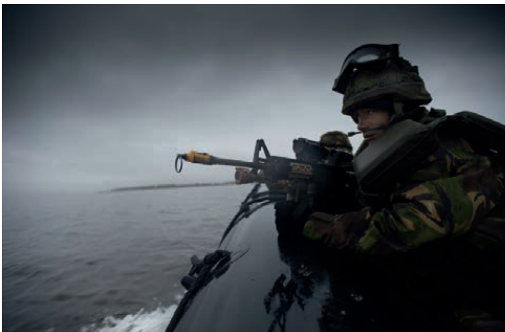
Oefening op het Hollands diep

Naast de aard van het werk en de doorgroeimogelijkheden, zijn ook het 'militair zijn' en de bedrijfscultuur aspecten die tot binding aan het bedrijf leiden. Deze aspecten worden echter minder snel en minder uitgebreid ter sprake gebracht en lijken een minder grote rol te spelen in de arbeidssatisfactie.