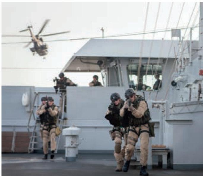
Boardingteam, afgezet met helikopter

Begin 2012 is een opvallend aantal verzoeken om individuele bemiddeling bij mijn staf binnengekomen van personeel waarvan de Verklaring van Geen Bezwaar door de Militaire Inlichtingen- en Veiligheidsdienst niet werd vernieuwd. Bij de vernieuwing van de verklaring wordt voor de afgifte ervan een controle uitgevoerd of personeel in de afgelopen jaren strafrechtelijk is veroordeeld. Vernieuwing vindt niet plaats indien de door de rechter opgelegde straf de in de beleidsregel vastgelegde norm overstijgt. Dat leidt voor hem of haar