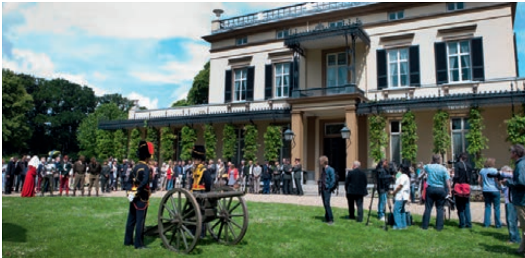
Opening van een expositie op Bronbeek

Zo bleek bij het Koninklijk Tehuis Oud-militairen en Museum Bronbeek dat de reguliere procesgang en de product-dienst-catalogus van het Facilitair Bedrijf Defensie niet is afgestemd op een tehuisfunctie van vierentwintig uur per dag of museumfunctie met dagelijks bezoekers. In een tehuis moet adequaat kunnen worden ingespeeld op behoeften die acuut ontstaan. Wanneer schade ontstaat dan moet deze uit veiligheidsoverwegingen vaak direct gerepareerd kunnen worden. Commandant Facilitair Bedrijf Defensie zal in de evaluatie van zijn eenheid bezien of een gespecificeerde lokale dienstverleningsovereenkomst hieraan tegemoet kan komen.