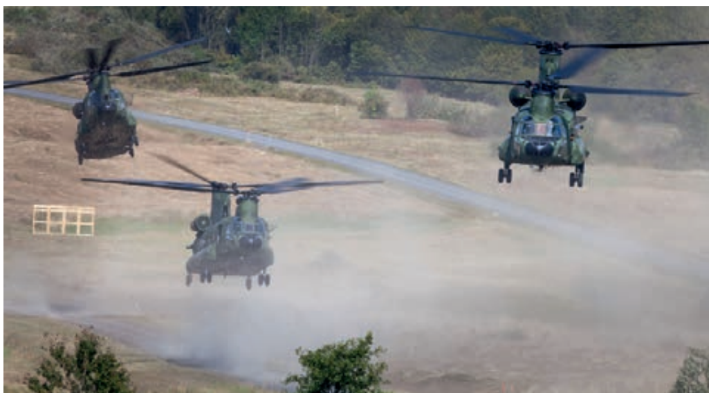
Chinooks tijdens oefening "Peregrine Sword"

Uit de themabezoeken komt naar voren dat er op het gebied van knelpuntcategorieën grote verschillen zijn tussen de Defensieonderdelen. Bij de Koninklijke Marechaussee (KMar) is vrijwel geen overtolligheid te verwachten bij het militaire personeel en zijn hiervoor geen knelpuntcategorieën vastgesteld, terwijl het Commando Landstrijdkrachten (CLAS) juist veel overtolligheid verwacht. Daar is het echter moeilijker te bepalen waar die overtolligheid zal ontstaan. Bij het Commando Zeestrijdkrachten (CZSK) zijn de knelpuntcategorieën per dienstvak of subdienstgroep vastgesteld. Het CLAS heeft gekozen voor een ruimere benadering (per rang) bij de vaststelling van de knelpuntcategorieën. Bestuursstaf, Commando DienstenCentra en