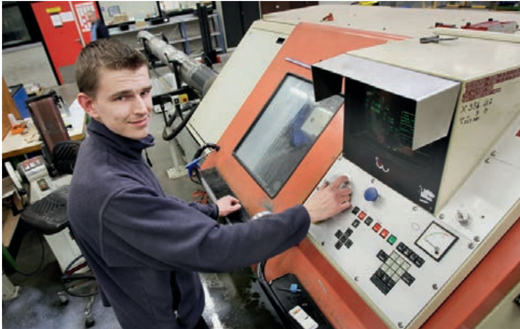
Technisch medewerker voert controle werkzaamheden uit

medewerker. Het bredere beeld van de waarde van een medewerker voor Defensie, de koppeling met loopbaanpatronen en afspraken over de ontwikkeling van het personeel worden dan niet meegewogen. Daar komt bij dat een vacaturehoudende commandant zijn eigen criteria kan hanteren; het personeel toonde weinig vertrouwen in deze werkwijze.