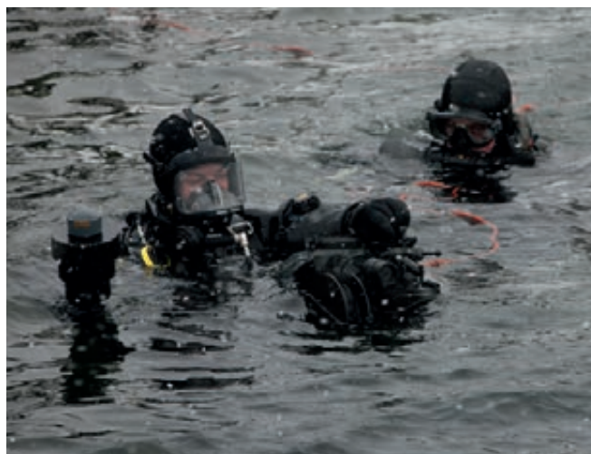
Marineduikers bieden met sonar beeld onder water

Naast de verschillende militaire taken zoals mijnenbestrijding en onderhoudswerkzaamheden onder marineschepen bestaat een belangrijk deel van het takenpakket van de Defensie Duikgroep uit het ondersteunen van de civiele autoriteiten. De eenheid levert gegarandeerde duikcapaciteit voor kustwacht en veiligheidsregio's en twee parate havenbeschermings-teams. Tevens levert deze eenheid tegenwoordig vrijwel permanent bijstand aan het Korps Landelijke Politiediensten. Op verzoek van Politie en het Openbaar Ministerie zoekt men regelmatig met speciale sonarapparatuur naar vermiste personen of slachtoffers onder ijs en naar wapens die bij een misdaad zijn gebruikt. Zo is bijvoorbeeld de lanceerbuis teruggevonden die is gebruikt bij de aanslag op het Amsterdamse gerechtsgebouw.