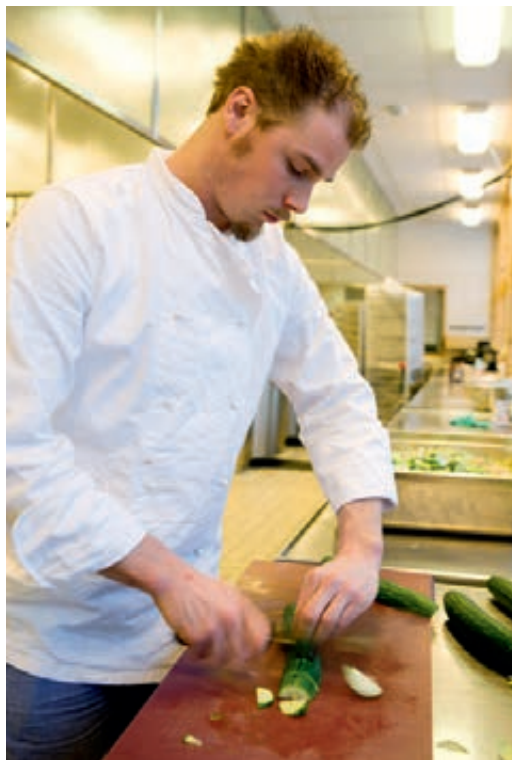
Koken voor 700 man die straks uit het veld komen