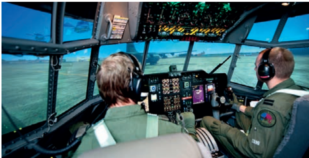
Vliegopleiding in de C-130 Herculesimulator

ICT is binnen Defensie onmisbaar geworden, zowel voor de dagelijkse bedrijfsvoering als in de uitvoering van de operationele taken. Hierdoor is het belangrijk de te gebruiken apparatuur en programmatuur actueel te houden. Bij veel werkbezoeken wordt de automatisering ter sprake gebracht. De kritiek loopt uiteen van een uiterst trage werking van het MULAN-systeem, zoals werd genoemd door personeel op het Plein Kalvermarkt Complex, tot verouderde programmatuur en systemen. Medewerkers van het Landelijk Opleidings- en Kenniscentrum Koninklijke Marechaussee wijzen op de verouderde ICT-onderwijsomgeving, waardoor bijvoorbeeld e-learning niet wordt gefaciliteerd. Bij de Dienst Vastgoed Defensie, Directie Noord, van het Commando Diensten Centra is aan de orde gesteld dat met verouderde versies en beperkte functionaliteiten wordt gewerkt vanwege de begrenzing in de ICT-omgeving. Gevreesd wordt dat dit de positie van de Dienst Vastgoed Defensie op de vastgoedmarkt en de benodigde kwaliteitscontrole op vastgoedbeheer negatief beïnvloedt.