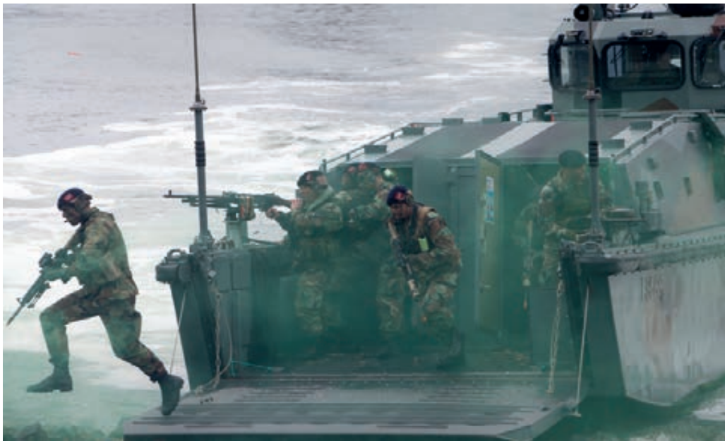
Mariniers voeren amfibische landing uit

Sourcing moet leiden tot 'beter en goedkoper'. Het onderwerp sourcing houdt het personeel van een aantal bezochte eenheden bezig. Dat speelde ondermeer bij de afdeling Materieellogistiek van het Commando Zeestrijdkrachten. Genoemde afdeling heeft onder andere te maken met het uitbesteden van onderhoud voor kleine vaartuigen zoals landings- en duikvaartuigen. Daarvoor is een quick scan uitgevoerd, maar nog geen besluit genomen. Momenteel wordt onderzocht of dit op termijn ook haalbaar is voor incidenteel onderhoud en welke consequenties dit heeft voor betreffende afdeling. Het personeel is niet overtuigd dat uitbesteden altijd goedkoper is en sneller en beter werkt. Men vindt dat ook gekeken moet worden naar de effecten hiervan op de langere termijn, in vergelijking met effectiviteit en efficiency van de eigen bedrijven.