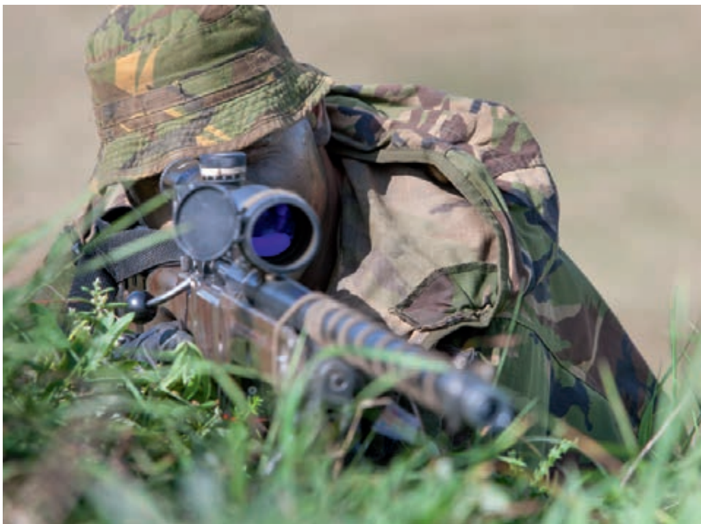
Lange afstandschutter

Behalve het tegengaan van verlies aan kennis en kunde doordat het wegvloeit, zijn er ook maatregelen te treffen om meer van de opgebouwde specialistische kennis en kunde te profiteren. Zo geeft specialistisch personeel aan loopbaanpatronen binnen hun specialisme te missen, waardoor de kennis en kunde niet optimaal worden benut. Tevens ontbreekt het veelal aan functionarissen die hier toezicht op houden of in sturen. In algemenere zin komt bij vrijwel elk werkbezoek de behoefte ter sprake aan een actiever personeelsbeheer en meer sturing in de uitvoering, zoals wel wordt toegepast bij MD-personeel. Het personeel vraagt om duidelijke loopbaanpatronen en een personeelsbeheer dat hier richting aan geeft.