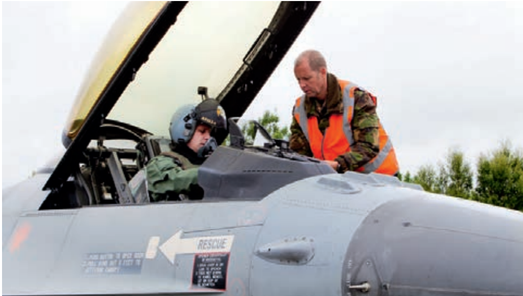
F-16 voor vertrek oefenvlucht

Regelmatig wordt het signaal afgegeven dat de taakverzwaring van het kader leidt tot een toename van risico's zoals schade aan complexe systemen en veilig varen. Een ander effect van het beperken van de opleidingstijd komt naar voren bij de commandant van het Materieel Evaluatie Orgaan, de eenheid die binnen het Commando Landstrijdkrachten is belast met de kwaliteitsbewaking van het materieellogistieke proces bij alle eenheden. Hij merkt op dat het niveau van het gebruikersonderhoud binnen het Commando Landstrijdkrachten laag is. Als mogelijke oorzaak wijst hij op de beperkte opleiding van de gebruikers. De directe steun van technisch personeel bij de eenheden is echter als gevolg van centralisatie afgenomen en ook de opleidingstijd van kaderleden is – onder druk van voorgaande reorganisaties – regelmatig bekort. Hierdoor is de begeleidende capaciteit bij de operationele eenheden beperkt en daardoor nauwelijks in staat het onderhoudsniveau op peil te brengen of te houden. Commandanten onderhoudspeloton signaleren dat het onderhoudspersoneel op het tweede echelon (de onderhoud-, diagnose- en bergingsgroepen) onvoldoende opleidingsplaatsen krijgt toegewezen. Daarmee gaat de kennis op dit niveau hard achteruit en kan het eerste echelon niet goed worden begeleid.