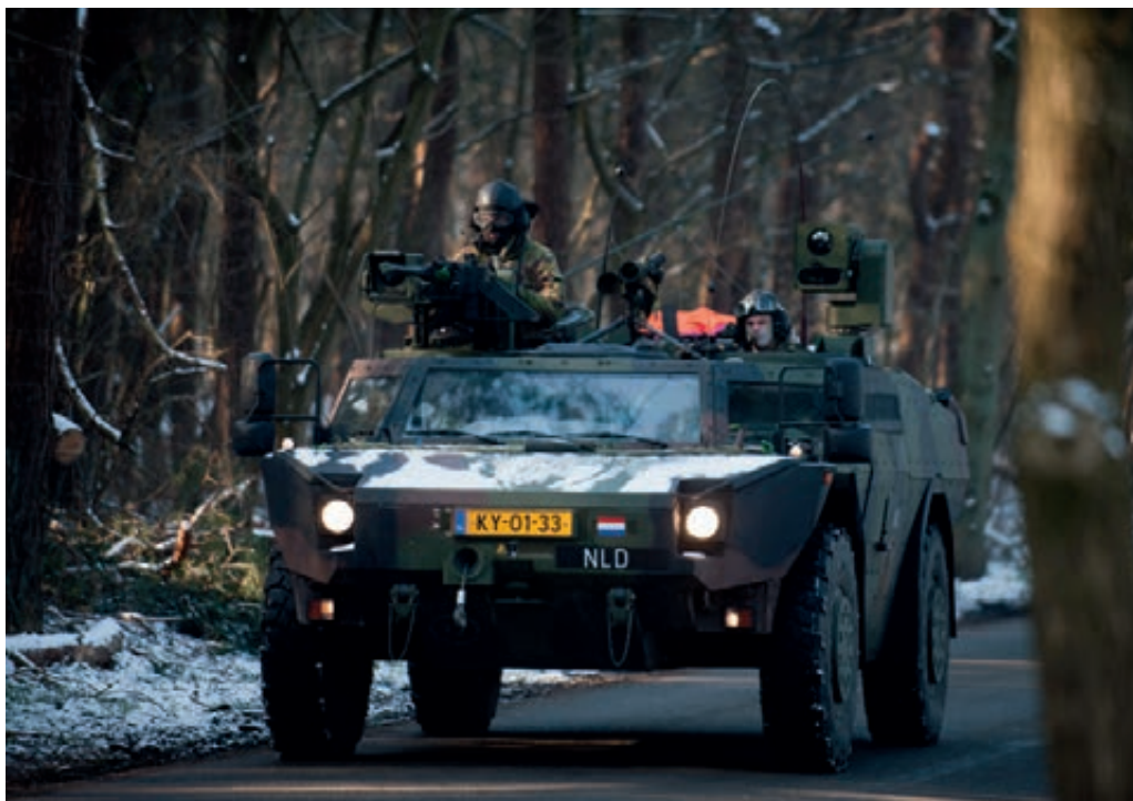
Oefening "Rino Dragonder"

Binnen de beleidsmatige kaders is begonnen met de afstoting van diverse operationele capaciteiten. De Leopard-tanks, vier mijnenbestrijdingsvaartuigen en het bevoorradingschip Hr. Ms. Zuiderkruis zijn inmiddels buiten dienst gesteld en wachten op een definitieve bestemming. Onderzocht is of het aanhouden van overtollig materieel voor reserveonderdelen doelmatiger is dan verkoop. Besloten is drie van de in totaal zes af te stoten pantserhouthuizers voor dit doeleinde te gebruiken, evenals alle veertig Fenneks en drie van de negentien F-16's 1 . Ook andere operationele capaciteiten konden worden behouden. Zo worden alle vier patrouilleschepen in dienst genomen, blijft het derde DC-10 transporttoestel langer operationeel en worden acht van de zeventien Cougar transporthelikopters langer in dienst gehouden.