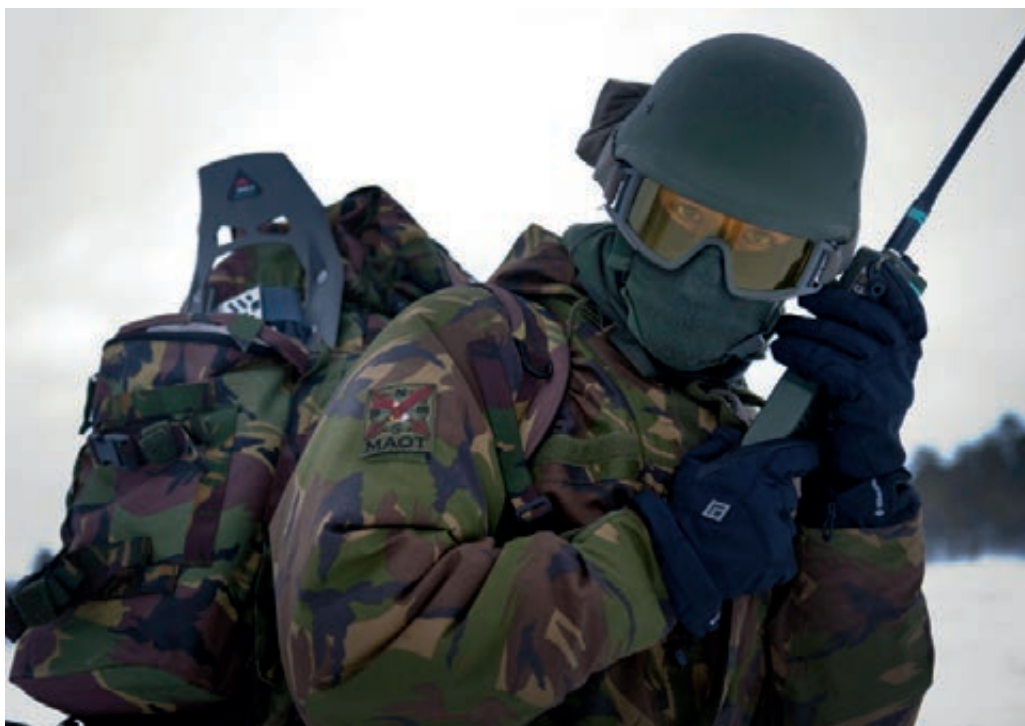
Mobile Air Operation Team tijdens oefening "Snow Blaze"

Zowel medewerkers als commandanten zijn niet overtuigd dat de P-instrumenten bijdragen tot de uiteindelijk gewenste personeelsofbouw van Defensie. In die zin blijkt geen van de instrumenten te voldoen aan de verwachtingen. De numerus fixus wordt vooral bekritiseerd om de strakke en financieel gedreven kaders waarbinnen moet worden gemanoeuvreed, terwijl de flexibiliteit op de werkvloer om de opgedragen taken uit te kunnen voeren is afgenomen. De P-instrumenten knelpuntcategorieën en vacaturebank scheppen eerder onduidelijkheid en onrust dan dat zij bijdragen aan transparantie en vertrouwen. Over de waarde van het SBK zijn de meningen verdeeld. Wel vinden zowel commandanten als medewerkers in de knelpuntcategorieën dat het SBK de vrijwillige uitstroom van personeel niet genoeg stimuleert.