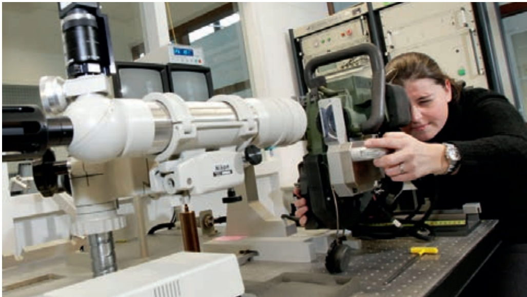
Medewerker controleert optisch richtmiddel

aanpassingen voor de belegging van taken, verantwoordelijkheden en bevoegdheden in de nieuwe organisaties van het Commando Zeestrijdkrachten en de Defensie Materieel Organisatie om de zeewaardigheid te waarborgen.