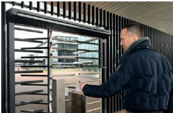
Ingang Kromhoutkazerne

In 2011 is de “nieuwe” Kromhoutkazerne te Utrecht in gebruik genomen. De infrastructuur van deze kazerne is ingericht op “het nieuwe werken”. Medewerkers hebben formeel geen vaste werkplek meer, maar werken in een open kantooromgeving. Het personeel geeft aan dat zij inmiddels goede ervaringen heeft met