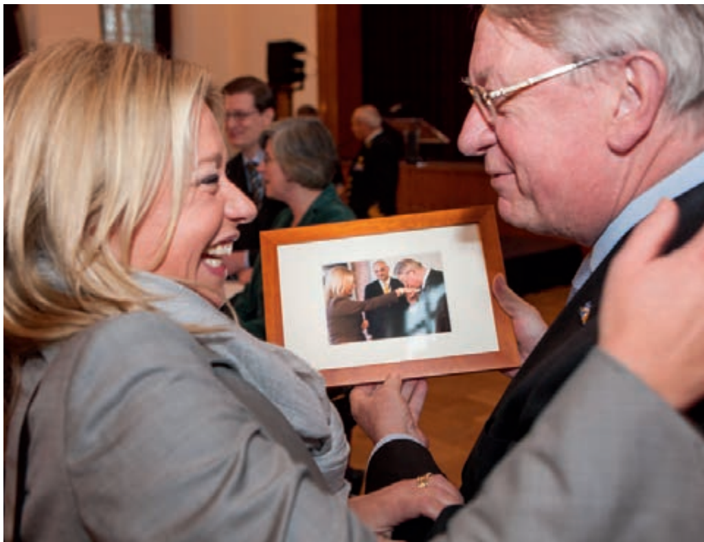
Wisseling top van defensie

De werkwijze van de Bestuursstaf wordt zo ingericht dat sprake is van één formatie die onder de Plaatsvervangend Secretaris-Generaal wordt geplaatst en vervolgens verdeeld wordt onder de directies. Hierdoor kan de capaciteit van de Bestuursstaf flexibel worden ingezet. Thematisch samenwerken is het uitgangspunt, zodat maximaal gebruik kan worden gemaakt van aanwezige kennis en ervaring. De nieuwe Hoofddirectie Beleid wordt verantwoordelijk voor het maken van geïntegreerd beleid en er komt een centrale toewijzing van middelen door de Commandant der Strijdkrachten. De nieuwe Hoofddirectie Bedrijfsvoering maakt integrale kaders en de Hoofddirectie Financiën en Control ziet er op toe dat alles past binnen de budgettaire kaders. Het Definitief Reorganisatieplan is 5 november 2012 geaccordeerd.