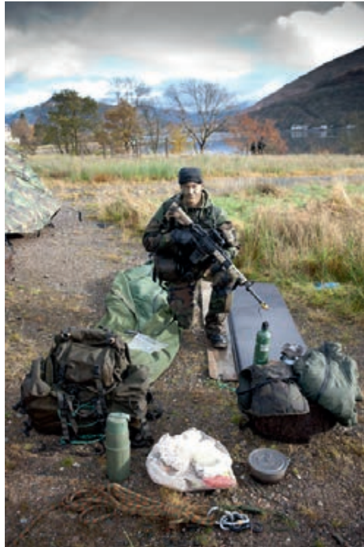
Marinier en zijn uitrusting tijdens bergtraining in Schotland

De ketenbedrijven van de Defensie Materieel Organisatie zijn in 2012 onderworpen aan een sourcingstoets. Gekeken is welke activiteiten Defensie niet beslist zelf hoeft uit te voeren, maar uitbesteed kunnen worden aan de markt. Aan de andere kant is sourcen ook het aanbieden van specialistische diensten, kennis en capaciteiten aan anderen (binnen en beperkt buiten de overheid) om zo het rendement te verhogen. Uitgangspunt is dat sourcing Defensie slagvaardiger, flexibeler en goedkoper maakt.