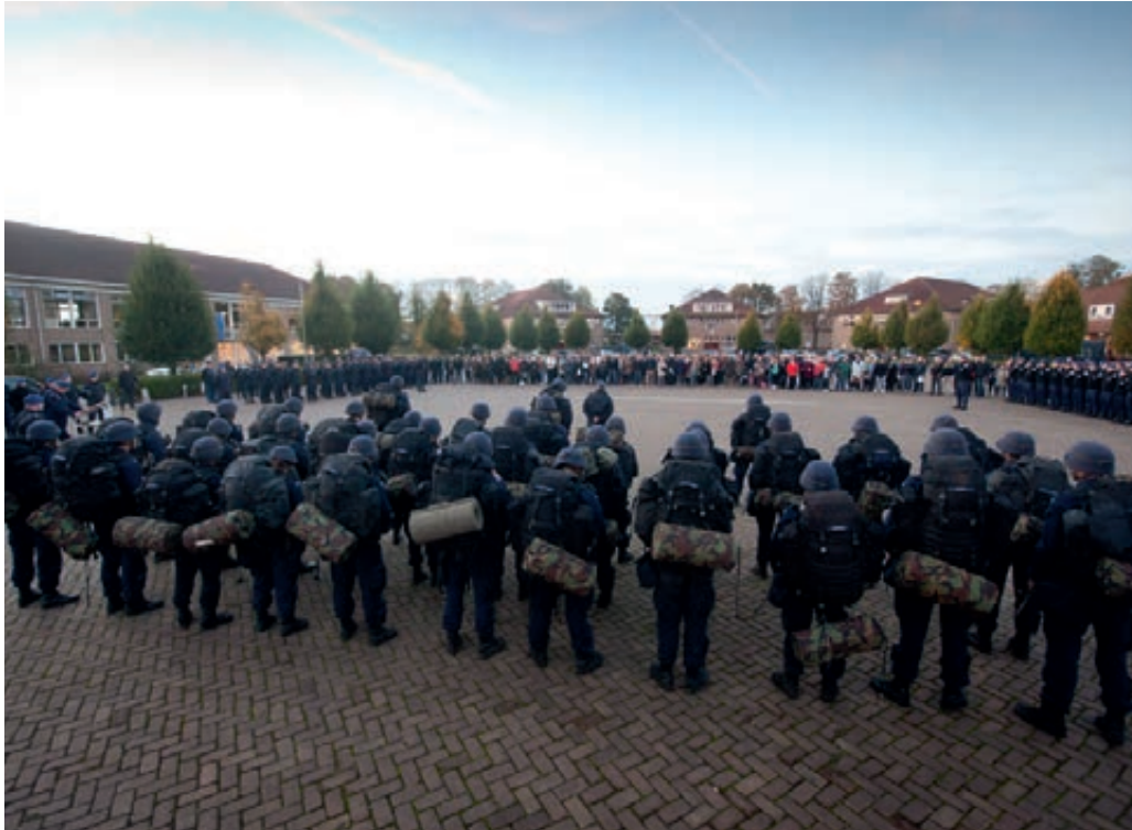
Baretuitreiking bij de Koninklijke Marechaussee na afronding initiele opleiding

gevonden door het verschuiven van werktijden en het verroosteren van uren. Bij de leiding van het peloton is deze werkwijze echter veelal niet mogelijk waardoor het niet altijd lukt binnen de kaders van de Arbeidstijdenwet te blijven.