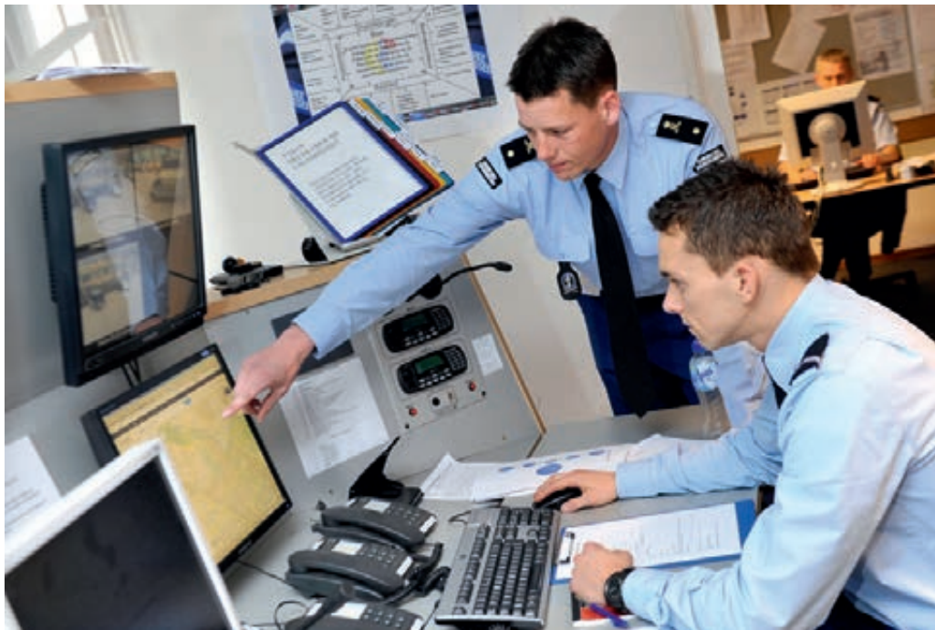
Meldkamer van de Koninklijke Marechaussee

toestemming gekregen de functieduur te verlengen bij die functies, waarbij roulatie van personeel de gewenste continuïteit bij handhaving van de openbare orde ernstig zal verstoren. Dit kan onder meer het geval zijn voor bepaalde functies als hulpofficier van justitie.