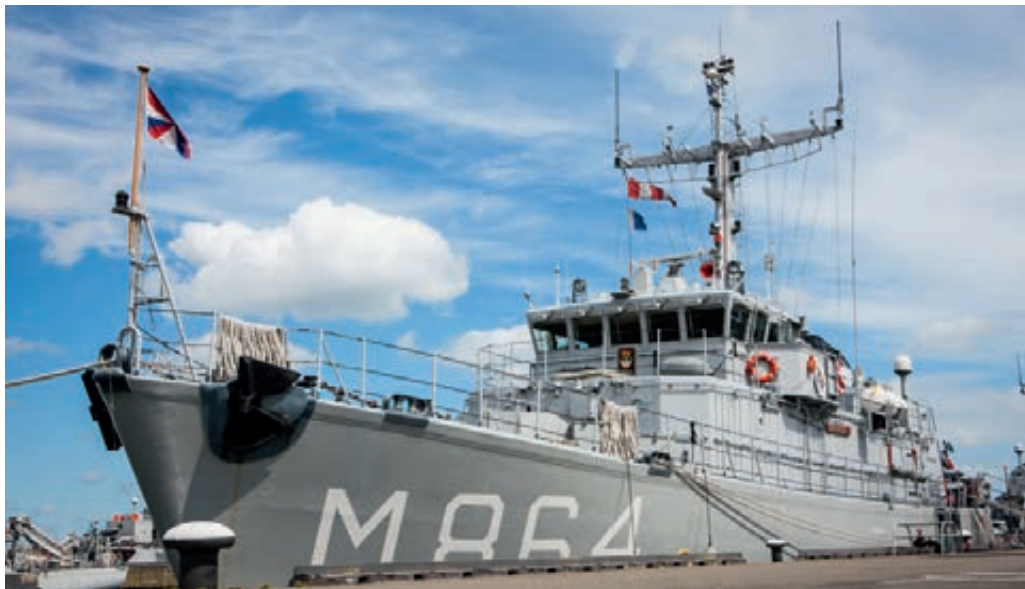
Mijnenjager Hr.Ms. Willemstad

Bij de bezoeken aan in het buitenland gelegerde eenheden werden in de gesprekken met het personeel vrijwel altijd de buitenlandtoelage en onduidelijkheid over het ‘boodschappenmandje’ gemeld als zorgpunt. Men weet niet welke criteria worden gehanteerd, waardoor men het gevoel heeft dat de normen – ondanks periodieke metingen – geen reële afspiegeling zijn van de situatie ter plaatse. De buitenlandtoelage voor bijvoorbeeld personeel in de Verenigde Staten wordt algemeen te laag gevonden. Ondanks het feit dat na eerdere klachten een onderzoek is gehouden door de Audit Dienst Defensie, waarin geconcludeerd werd dat de buitenlandtoelage volgens een juiste methodiek is berekend, geeft het personeel aan vaak tekort te komen. Men stelt dat onvoldoende rekening wordt gehouden met verschillen in kosten tussen de verschillende Staten in Amerika en het feit dat de kosten van levensonderhoud de laatste jaren sterk zijn gestegen. Als voorbeelden van de hoge kosten worden genoemd de sterke verhoging van brandstofprijzen en kosten van elektriciteit, water, kabel en primaire levensmiddelen zoals brood en groente. Aangegeven wordt dat ondanks het feit dat het enthousiasme voor het werk bij het personeel hoog is, veel medewerkers een plaatsing in het buitenland om financiële redenen afwijzen. De zorg wordt geuit dat de kwaliteit van het werk in de Verenigde Staten onder druk zal komen te staan als niet de juiste mensen op functies in het buitenland solliciteren.