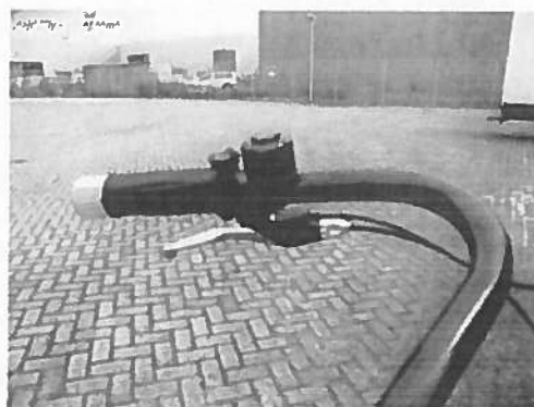
Afbeelding 3. De bel op het stuur

De Swing beschikt niet over richtingaanwijzers. Richting aangeven moet dus gebeuren door de hand uit te steken.