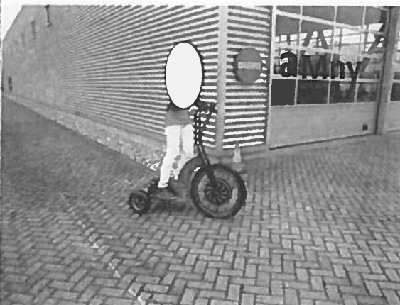
Afbeelding 1a en 1b. De Swing

Met de knijprem aan de rechterkant van het stuur remt men op het voorwiel en met de knijprem aan de linkerkant van het stuur remt men op de achterwielen. Gas (stroom) geeft men door met de duim op een handel te drukken aan de rechterkant van het stuur. De Swing heeft geen verlichting. Aan de achterzijde is een ronde rode reflector bevestigd (zie Afbeelding 2). Aan de linkerkant van het stuur is een bel bevestigd (zie Afbeelding 3). Het stuur is niet op hoogte instelbaar.