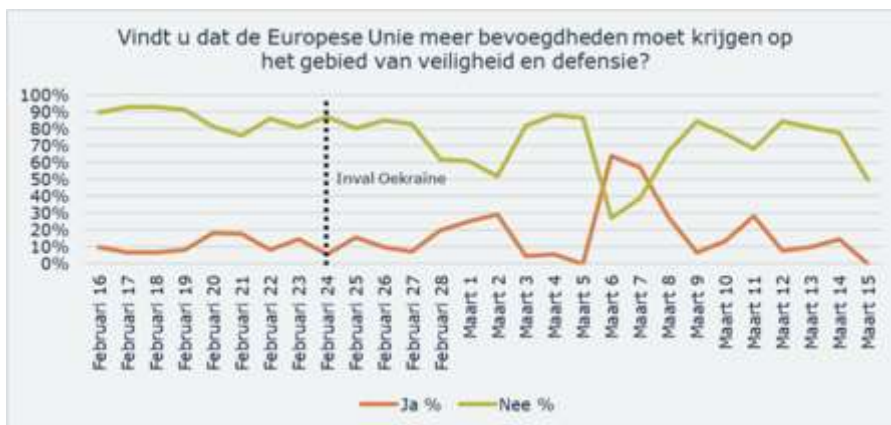
Figuur 2: ja/nee respons op vraag 5 geanalyseerd in een tijdlijn

Op basis van de reacties op vraag 5 is in een tijdlijn in kaart gebracht hoe de ja/nee respons zich heeft ontwikkeld. Dit om na te gaan of er een verschil in reacties is na de inval van Rusland in Oekraïne. Op basis van deze consultatie is geen duidelijk verband gevonden tussen de Russische invasie in Oekraïne en de opinie over Europese defensie- en veiligheidssamenwerking. Dit kan te maken hebben met het feit dat er veel meer reacties binnen zijn gekomen vóór het uitbreken van het conflict in Oekraïne dan daarna.