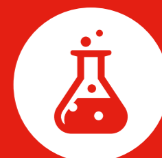
Dreiging van chemische, biologische, radiologische en nucleaire middelen (CBRN)