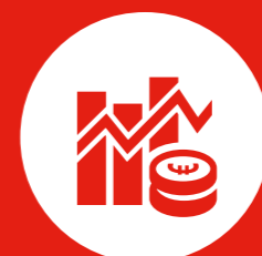
Bedreiging van vitale economische processen