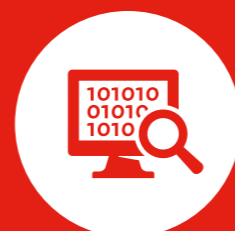
Ongewenste buitenlandse inmenging en ondermijning