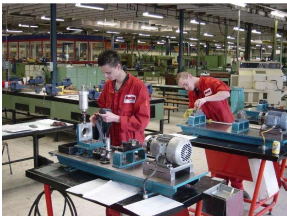
Foto: Twee werkende kandidaten bij Stre@m Opleidingen