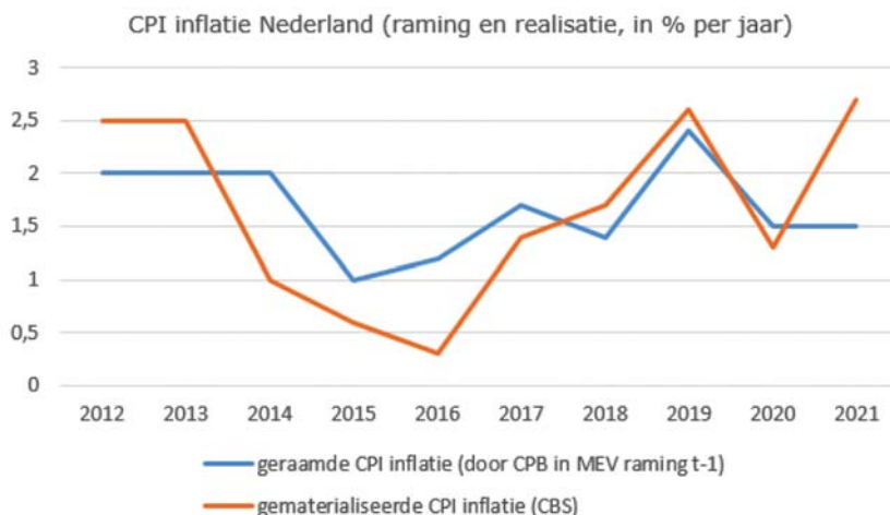
Figuur 1: CPI inflatie Nederland (raming jaar t-1 en realisatie jaar t)

Figuur 1 zet over de afgelopen tien jaar waar inflatiecijfers voor beschikbaar zijn de inflatieraming van het CPB uit de Macroeconomische Verkenning (MEV) uit het voorgaande jaar af tegen de daadwerkelijke gerealiseerde inflatie in dat jaar voor Nederland, conform de CPI-methode. 10 De som van alle afwijkingen van de raming versus de realisatie in de afgelopen 10 jaar (de «som» van de afwijking) betreft -0,1. Dit wijst erop dat er geen structurele afwijking in de raming zit en er geen sprake is van structurele over- of onderschatting. De raming overschatte de inflatie in 5 van de 10 jaren en onderschatte de inflatie eveneens in 5 van de 10 jaren. Als zodanig is er gemiddeld genomen een beperkt verschil tussen raming en realisatie.