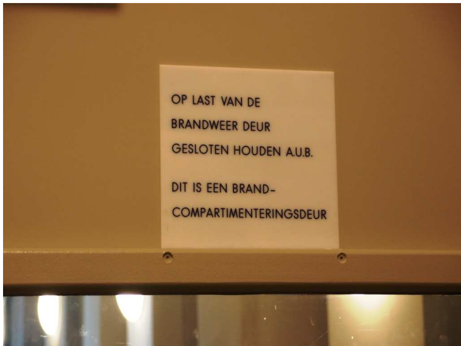
Waarschuwing op een brandwerende deur.