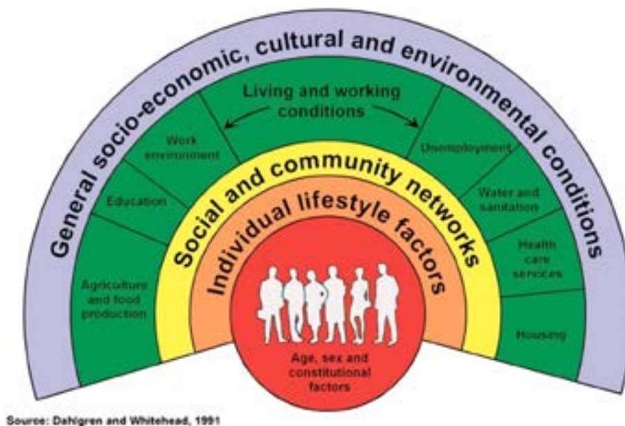
Figuur 2: Sociale determinanten van gezondheid

Een gezonde leefomgeving is essentieel om gezondheid van mensen te stimuleren. Dahlgren en Whitehead 55 (zie Figuur 2) geven aan dat persoonlijke eigenschappen, individuele leefstijlfactoren, sociale netwerken, leef- en werkcondities, en de bredere sociaal-culturele en economische omgeving gezamenlijk bepalend zijn voor gezondheid.