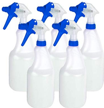
Figuur 2 Spuitflacons of triggersprays

De toegelaten gewasbeschermingsmiddelen voor particulieren zijn 'ready-to-use' oplossingen met 6% azijnzuur. De kant-en-klare producten zitten in een spuitflacon ('triggerspray'; zie Figuur 2). De dosering is 0,1 liter vloeistof per vierkante meter, dit komt overeen met 6 gram azijnzuur per m 2 . Bij pleksgewijze toepassing wordt aangenomen dat 10% van het oppervlak wordt behandeld en wordt daarom gerekend met een 10 maal lagere dosering (0,6 g/m 2 ). Oppervlakten mogen maximaal 4-6 keer per jaar worden behandeld waarbij er 14 dagen tijd moet zitten tussen de behandelingen.