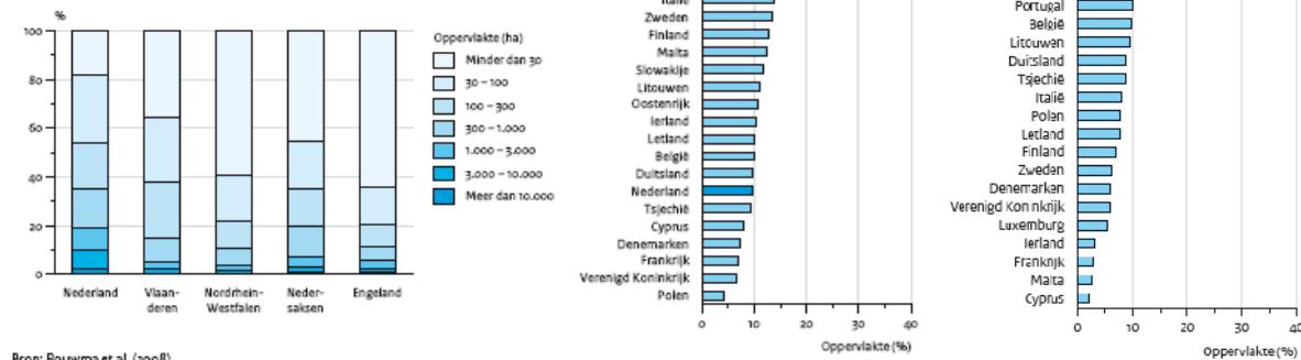
Figuur 1. Nederland in vergelijking met andere landen en buurregio's.