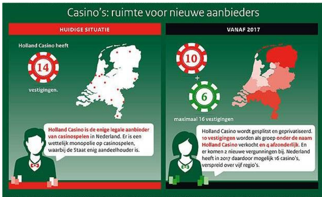
Figuur 2. Samenvatting wijzigingen casinomarkt