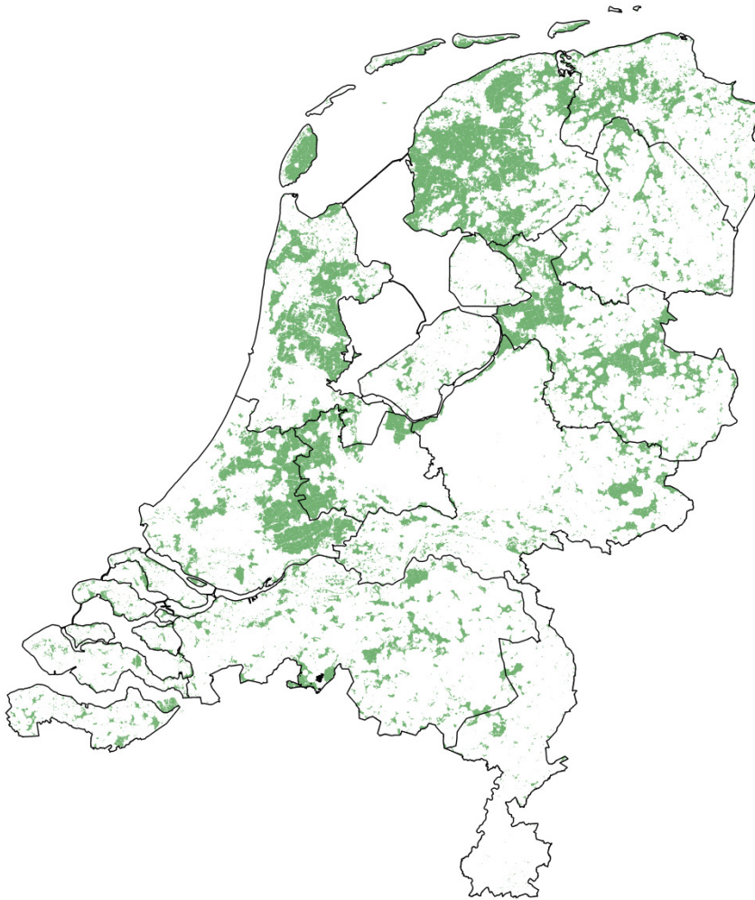
Figuur 1 Het gebied dat bij de berekeningen in beschouwing is genomen (q35-gebied + ANLb-weidevogels). Toelichting: zie tekst.

Bij het vormgeven van de scenario's en de daaraan verbonden berekeningen zijn de ecologische randvoorwaarden van de grutto als leidend gehanteerd. Van de andere soorten is daarop aansluitend op basis van hun eigen ecologische karakteristiek berekend wat de te verwachten aantallen zijn.