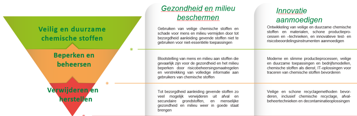
Figuur: De giftvrije hiërarchie — een nieuwe hiërarchie in het beheer van chemische stoffen

manier die hun bijdrage aan de samenleving (inclusief de groene en digitale transitie) maximaliseert en tegelijkertijd schade aan de planeet en de huidige en toekomstige generaties voorkomt. De strategie ziet de EU-industrie als een speler die op wereldschaal concurrerend is in de productie en het gebruik van veilige en duurzame chemische stoffen. In de strategie wordt een duidelijk stappenplan en een tijdschema voorgesteld voor de transformatie van de industrie met het oog op het aantrekken van investeringen in veilige en duurzame producten en productiemethoden.