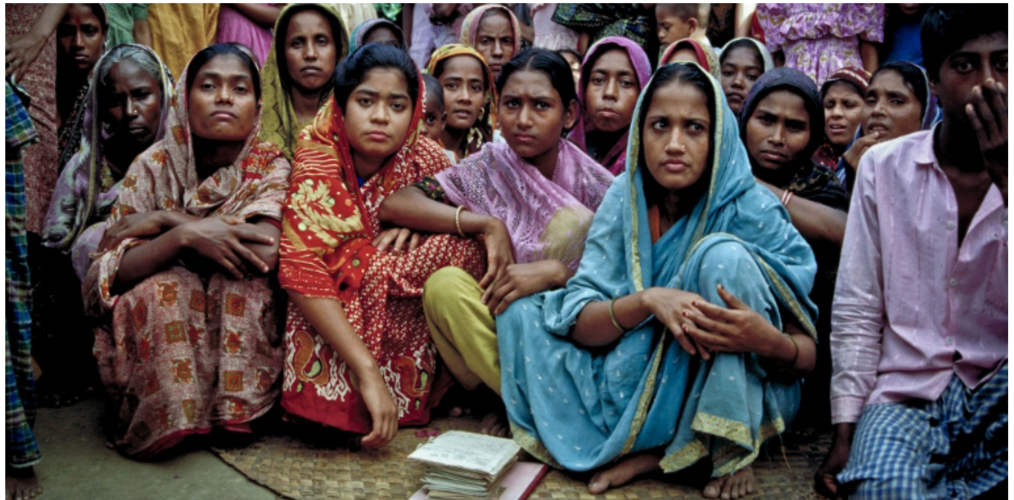
Asian Development Bank (CC BY-NC-ND 2.0)

Vakbonden zijn een verboden vrucht in veel textiel-producerende landen