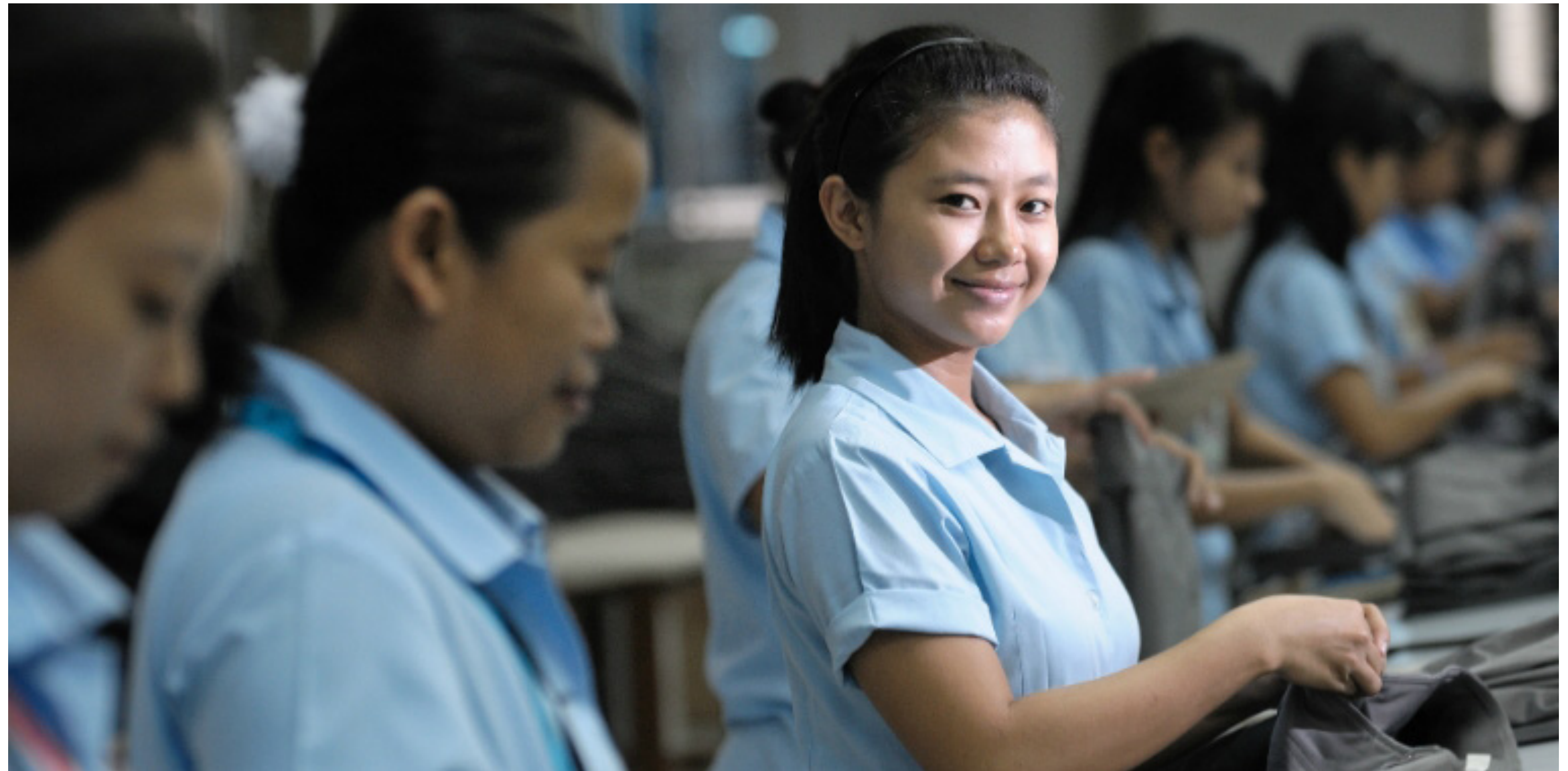
ILO in Asia and the Pacific (CC BY-NC-ND 2.0)

Deze mode- merken kleden textiel- arbeiders niet uit