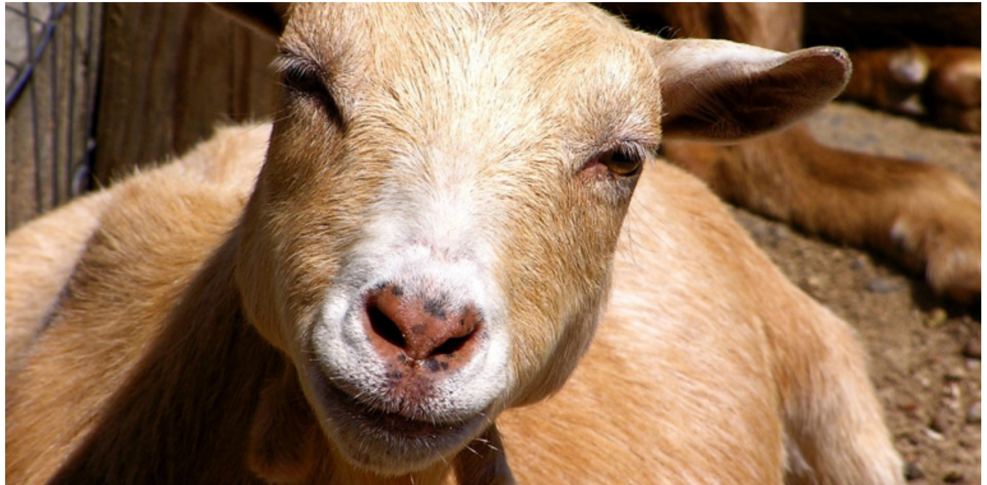
Liz West (CC BY 2.0)

Deze modemerken vinden dierenleed ondraaglijk