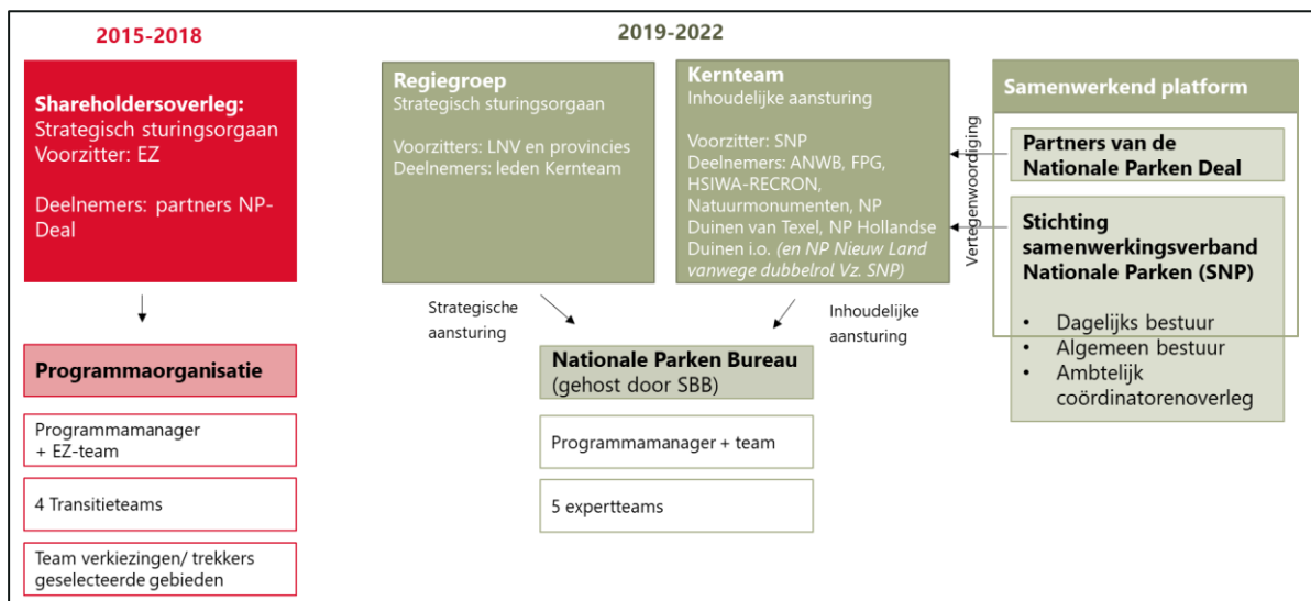
Figuur 2 Overzicht van de voormalige en huidige organisatiestructuur van het Programma

Sinds 2019 wordt het Programma aangestuurd door de Regiegroep. Het shareholdersoverleg, dat van 2015 tot 2018 bestond, is hiermee komen te vervallen. De Regiegroep is verantwoordelijk voor de strategische aansturing en heeft besluitvormend mandaat. Het besluit onder andere over het jaarplan en ziet toe op de voortgang via de jaarlijkse verantwoordingsrapportage.