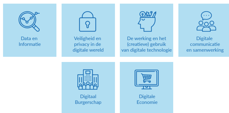
Figuur 1: overzicht van de grote opdrachten

Op basis van de visie zijn zes grote opdrachten te formuleren. De grote opdrachten omschrijven de grote thema's die relevant zijn voor het leergebied digitale geletterdheid. In de grote opdrachten komen alle elementen vanuit de visie samen, volgens een holistische benadering. In de grote opdrachten worden de vier perspectieven verbonden aan de vier domeinen die hierboven beschreven staan.