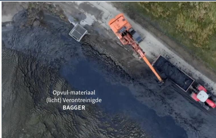
Opvul-materiaal (licht) Verontreinigde BAGGER

Verondieping op schaal 25 meter diep 3 meter leeflaag (BBK = 50 cm leeflaag)