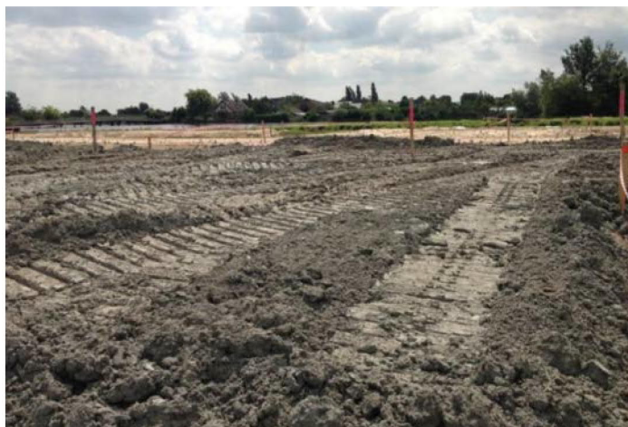
Figuur 5: Granuliet toegepast in een terreinophoging in Roelofarendsveen 2

Bij de verwerking van gesteenten komt fijn materiaal vrij. Hiervoor wordt eveneens de benaming 'granuliet' gebruikt. Onderstaande slaat op het fijne materiaal dat vrijkomt bij verwerking van gesteente. Figuur 5 laat een toepassing zien van granuliet 1 in een terreinophoging.