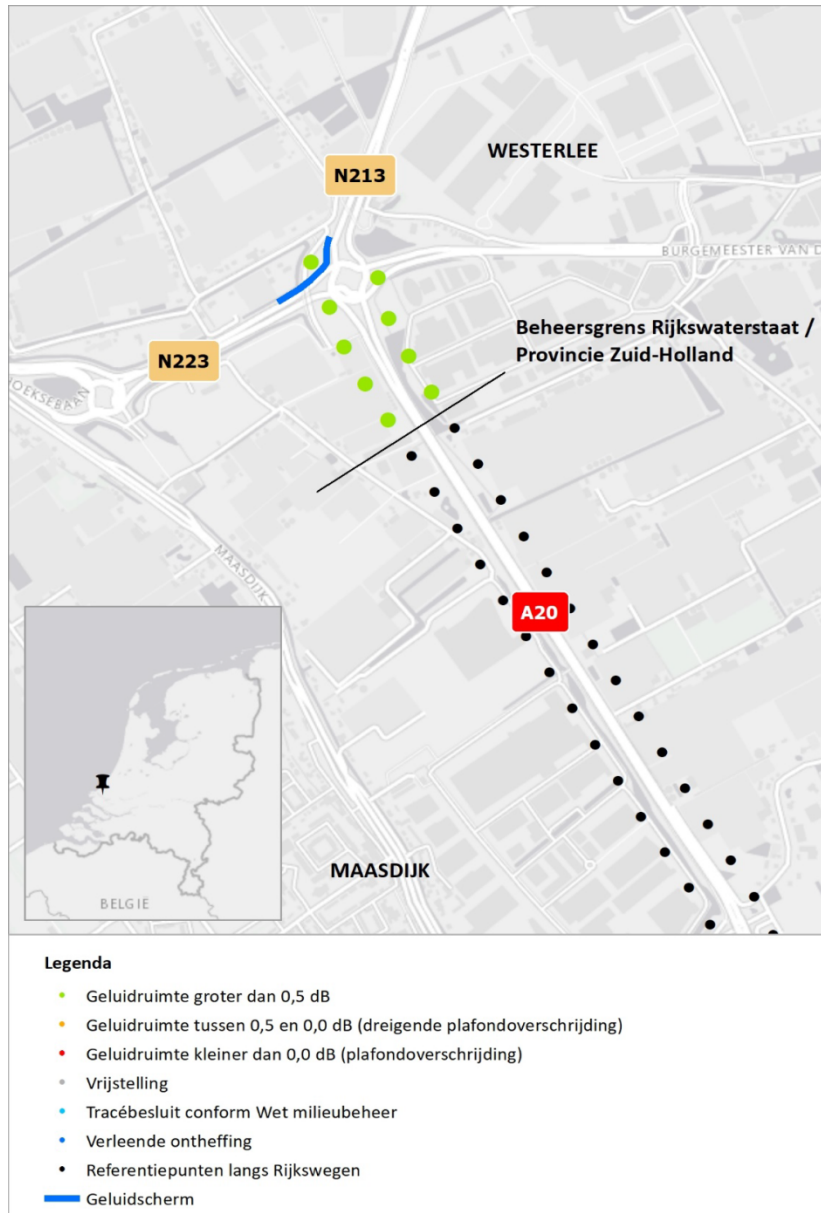
Figuur 2 Geluidruimte naleving 2018 t.o.v. geldende geluidproductieplafonds provinciale wegen