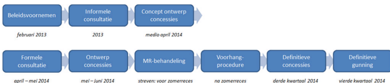
Figuur 1: proces beheerconcessie

Bij het proces van totstandkoming van deze beheerconcessie zijn verschillende partijen op verschillende momenten betrokken. Het doorlopen proces en het nog te doorlopen proces is schematisch weergegeven in figuur 1.