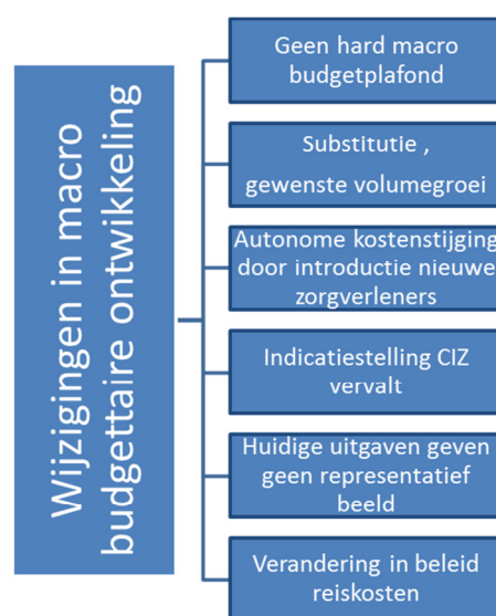
Figuur 5: Macro budgettaire ontwikkeling

De macro budgettaire ontwikkeling en beheersing zijn in figuur 5 en figuur 6 weergegeven.