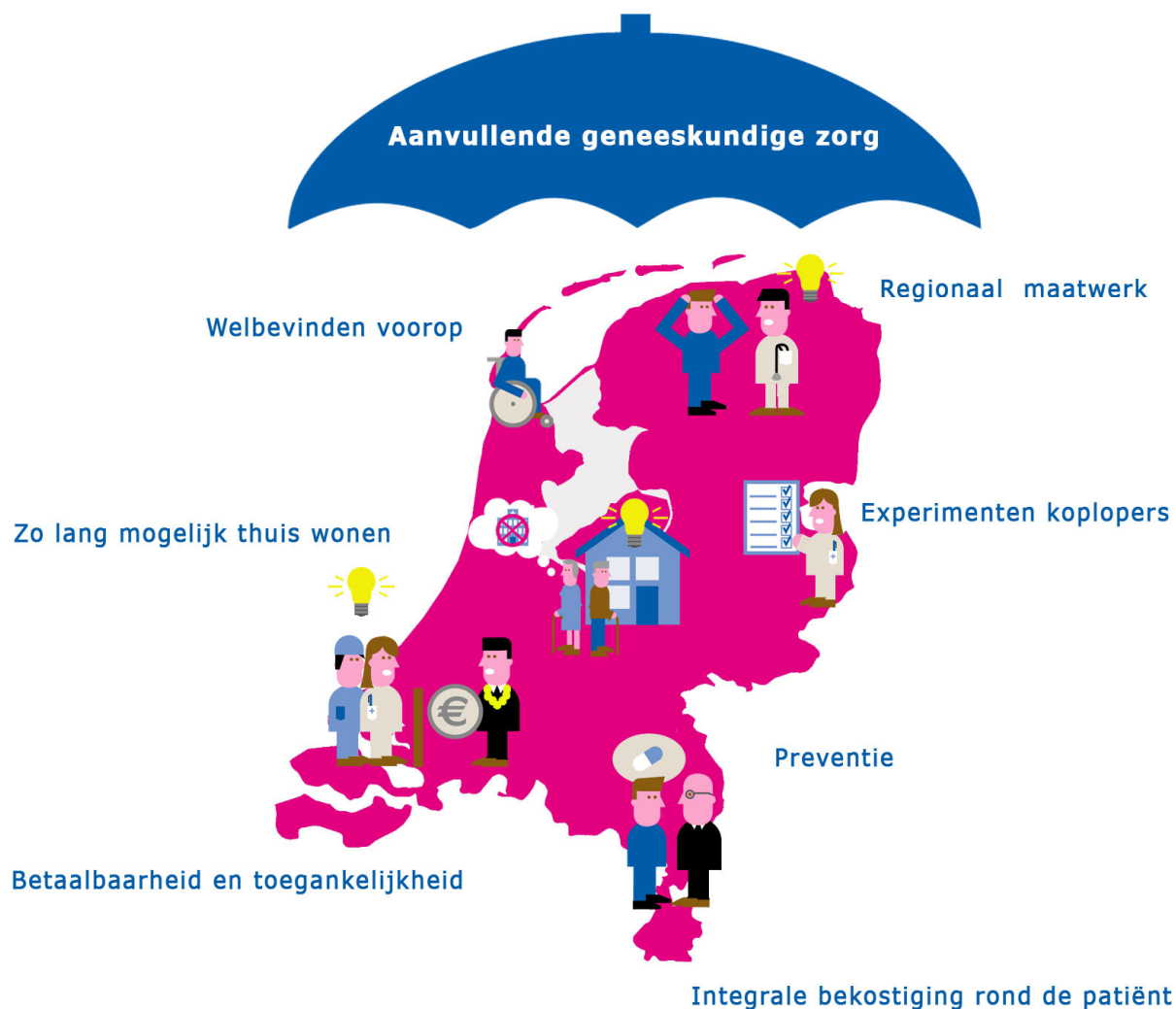
Figuur 4: Visualisatie kader bekostiging aanvullende geneeskundige zorg