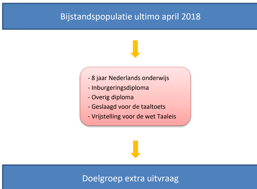
Figuur 2.1. Afbakening doelgroep

Indien gemeenten niet in staat waren om de omvang van de doelgroep ultimo april 2018 vast te stellen, hadden zij de mogelijkheid om zelf een ander peilmoment te kiezen en aan te geven welk moment dat is.