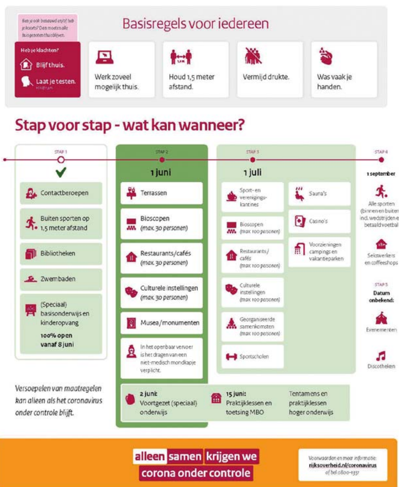
Figuur 1. Routekaart met stapsgewijze versoepeling van de maatregelen.