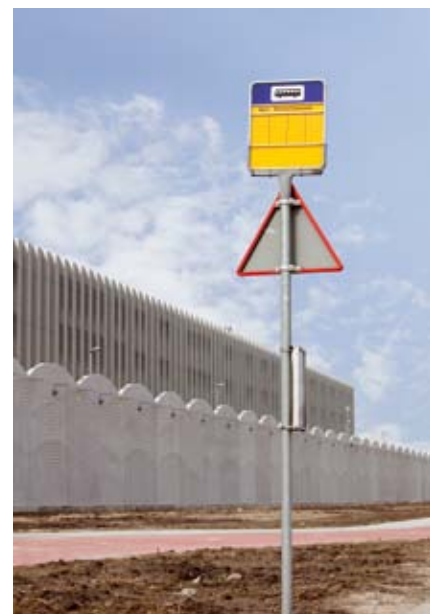
Asielzoekers zouden niet opgesloten moeten worden.

UNHCR en VluchtelingenWerk zien, naast ons humanitaire standpunt, geen reden om de GVA-procedure nog langer te handhaven, wanneer het beoogde doel van de GVA vaak niet wordt behaald.