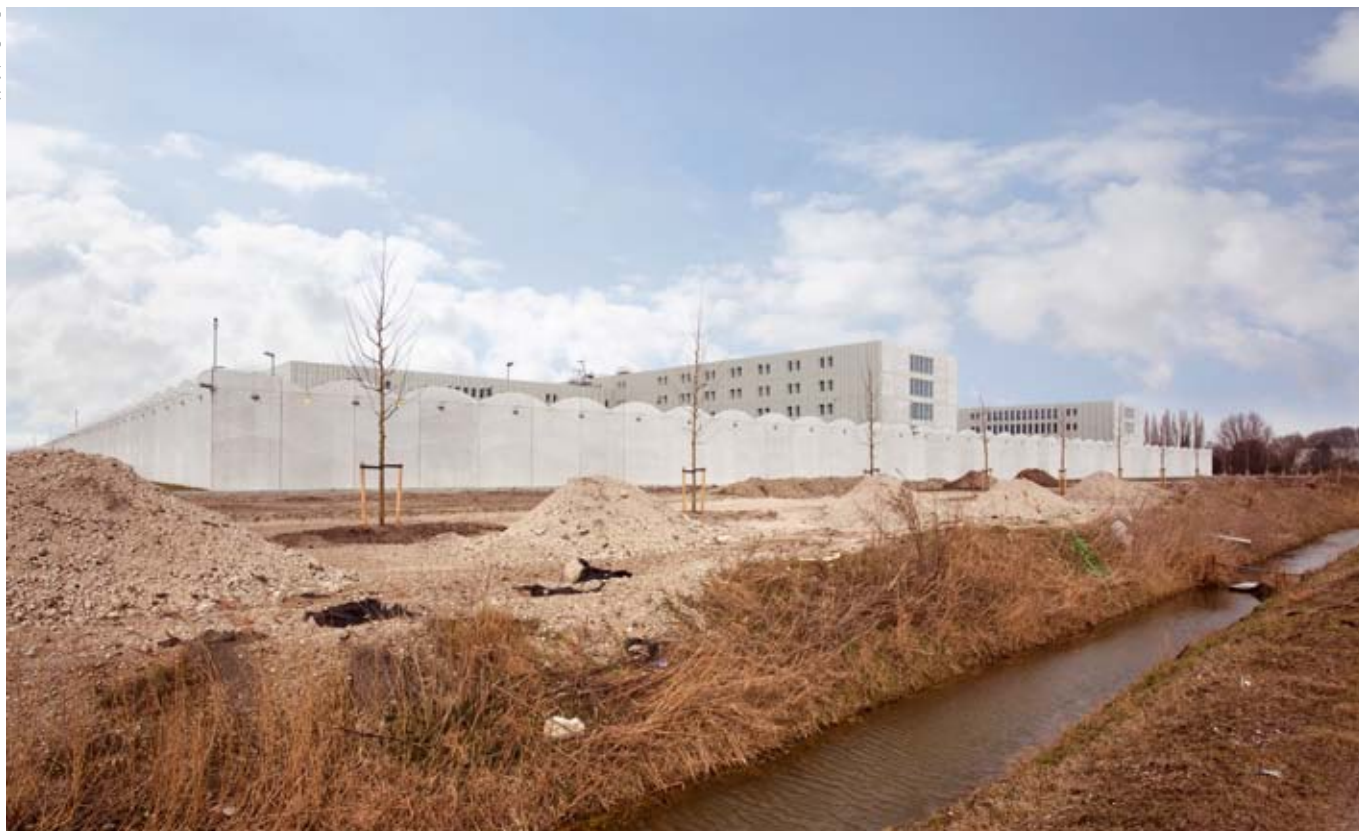
Binnen het strafrecht is detentie de zwaarste sanctie die kan worden toegepast.