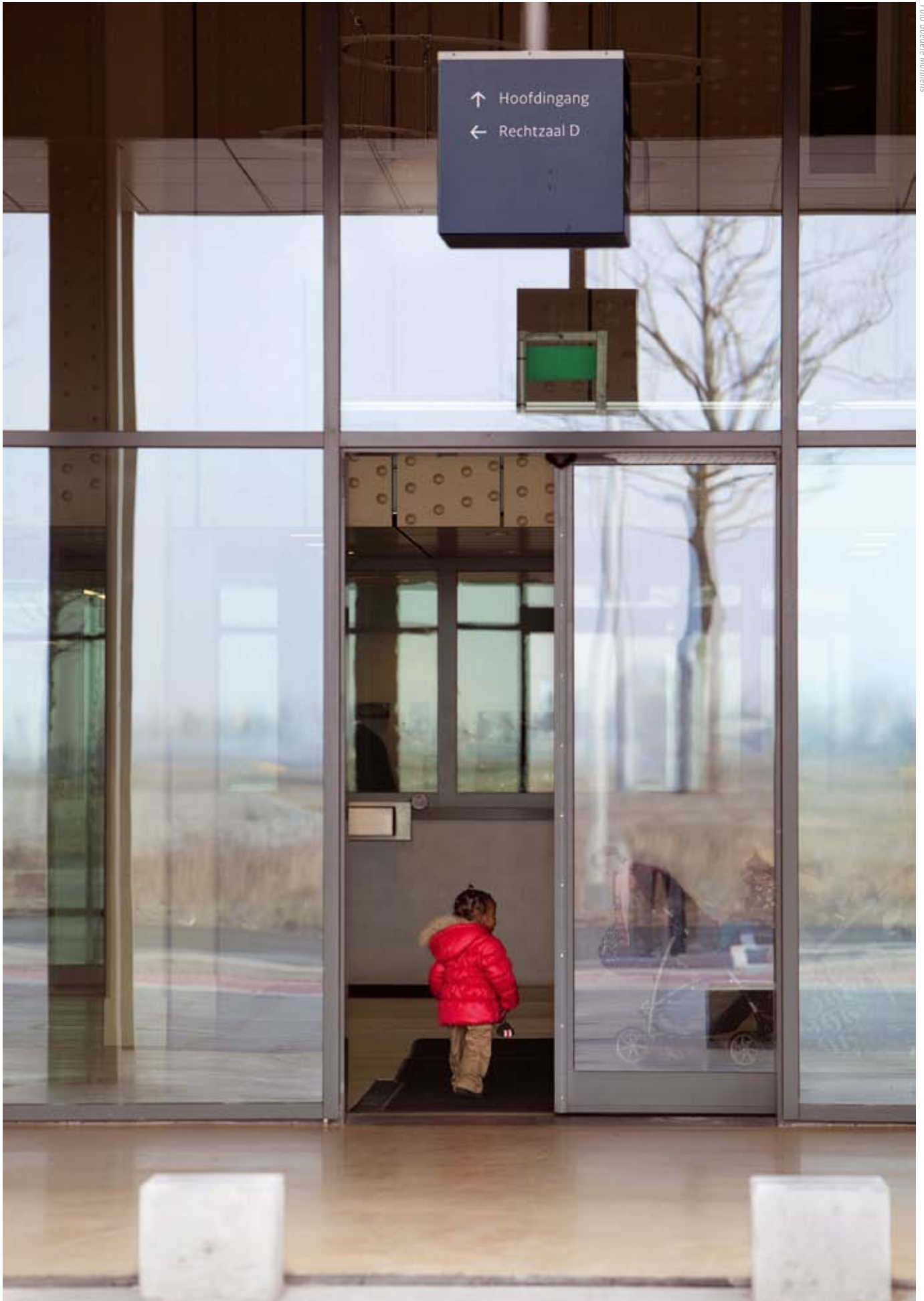
Asielzoekers zijn kwetsbare mensen die niets misdaan hebben en zouden daarom niet opgesloten moeten worden.