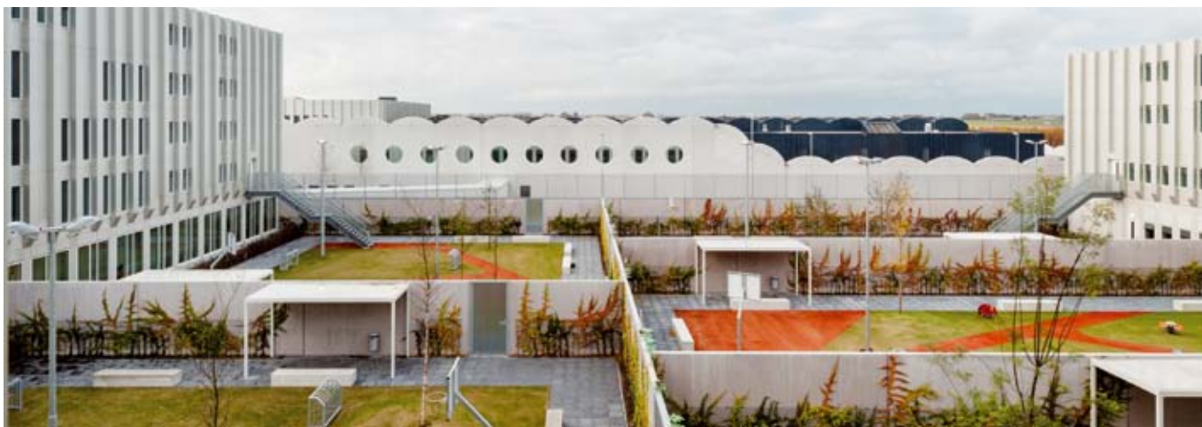
Asielzoekers die niets anders gedaan hebben dan asiel aanvragen, horen niet achter tralies.