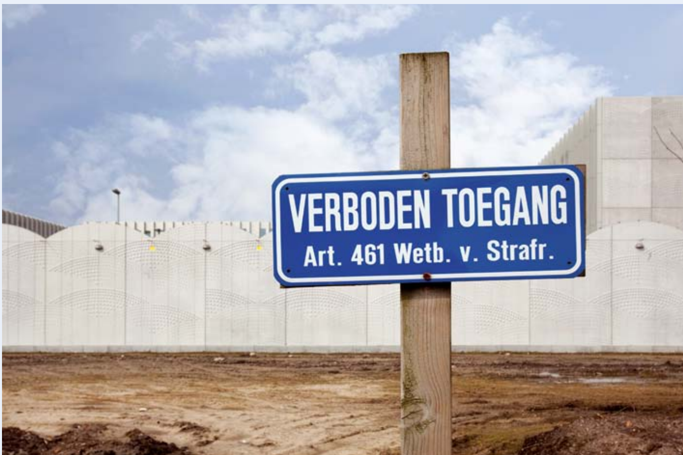
Asielzoekers die via een luchthaven Nederland binnenkomen en daar asiel aanvragen, worden opgesloten in het Justitieel Complex op Schiphol.

Dit is inmiddels ons derde onderzoek naar de Gesloten Verlengde Asielprocedure. De dalende trend die in onze vorige onderzoeken zichtbaar was, houdt aan. Niet alleen het aantal gedetineerden daalt, ook de duur van de detentie wordt elk jaar korter. Dat is een goede ontwikkeling en reden te meer om de procedure af te schaffen. Waarom deze vorm van detentie moet verdwijnen, komt naar voren in de hierop volgende juridische analyse, de recente onderzoekscijfers, maar bovenal de persoonlijke interviews.