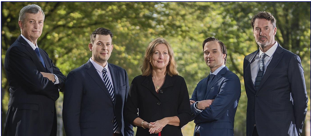
Afbeelding 2 - Samenstelling van de Toetsingscommissie Inzet Bevoegdheden

De Toetsingscommissie Inzet Bevoegdheden bestaat uit drie leden. Eén van de commissieleden is voorzitter. Ten minste twee van de drie leden moeten een achtergrond als rechter hebben. Het derde lid hoeft geen rechtelijke achtergrond te hebben, maar kan benoemd worden op grond van technische deskundigheid. Dat is thans het geval. De commissie wordt ondersteund door een secretariaat.