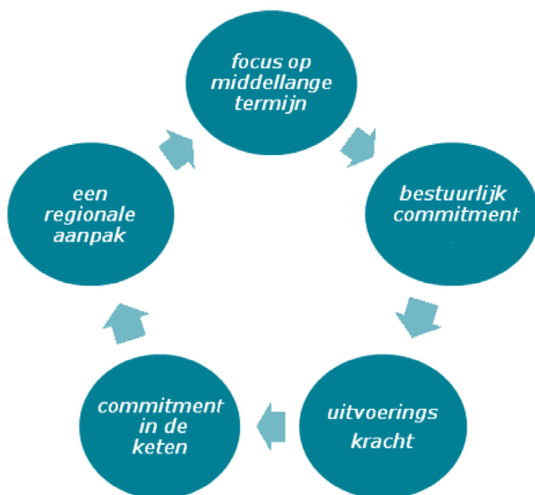
Figuur 4: succesfactoren inlopen achterstanden taakstelling

Zonder inzicht geen overzicht! Wie wil sturen op een sneller uitplaatsing van vergunninghouders naar gemeenten, moet inzicht hebben in actuele cijfers over instroom, doorstroom en uitstroom van vergunninghouders in de COA-opvang. De Taskforce stelt vast dat de minister, in zijn rol als opdrachtgever, onvol-