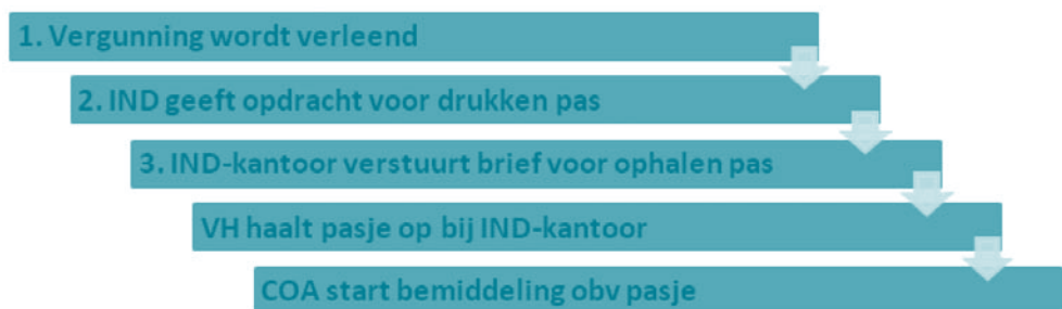
Figuur 6: het proces van afgifte en uitgifte van pasjes