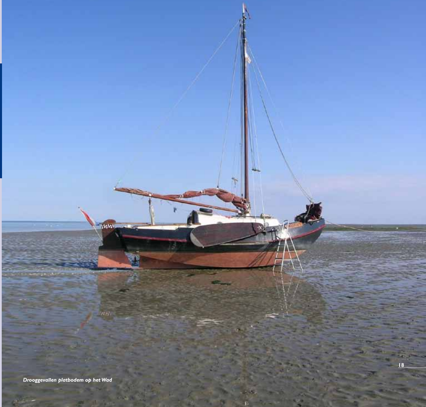
Drooggevallen platbodem op het Wad