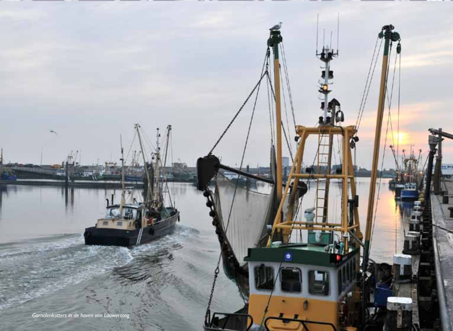
Garnalenkotters in de haven van Lauwersoog