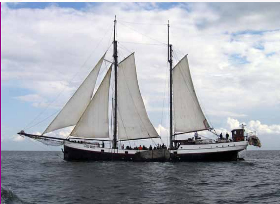
Zeilen op het Wad

In het Waddengebied vindt ook sportvisserij plaats met hengels, recreatieve visserij met vaste vistuigen (tot 2011) en recreatieve visserij door handmatig rapen van schelpdieren. De recreatieve visserij en de beroepsvisserij ervaren elkaars activiteiten als concurrentie om ruimte en om vis. Betere communicatie tussen beide groepen kan de situatie verbeteren: door duidelijkere afspraken over ruimtegebruik en het exploiteren van visbestanden kunnen conflicten vermeden worden.