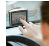
Thema Automotive en in-car