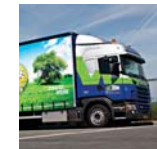
Thema Logistiek en internationaal