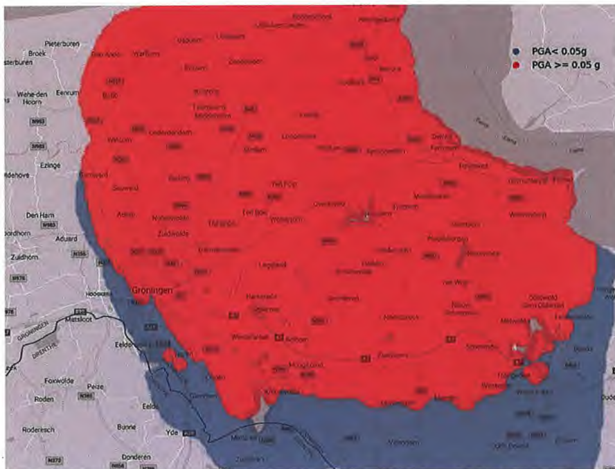
Figuur 2. Kaart met gebieden waarvoor beoordeling op aardbevingsbelasting nodig is volgens de NPR 9998 voor inzetstrategie 1. In blauw de zone met zeer lage seismiteit PGA < 0,05 g. In rood de zone met PGA \geq 0,05 g.