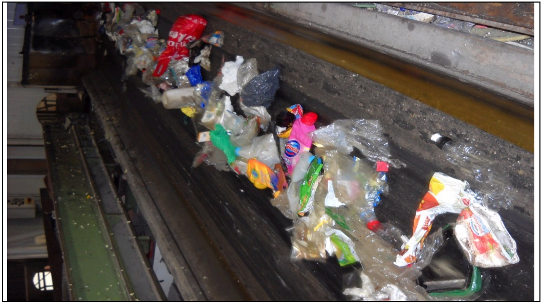
Huishoudelijke kunststof verpakkingen op sorteerband