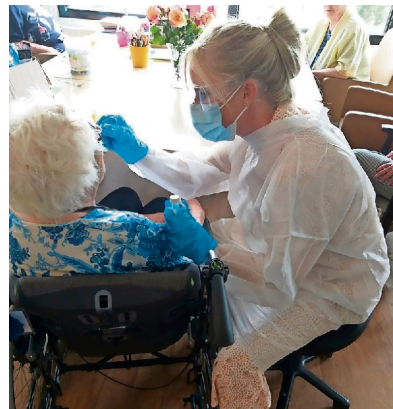
Verpleegkundige neemt een coronatest af bij een bewoner.

Van Vliet laat zich niet uit over welke etages onder het quarantaine-regime vallen. „De familie van de bewoners is al ingelicht over de nieuwe regels. De deuren zijn niet op slot, er is geen bezoekverbod. Bezoek op deze afdelingen kan alleen plaatsvinden als er beschermende maatregelen worden getroffen. We hebben meer dan voldoende beschermingsmateriaal en het personeel is voorbereid.” De positieve test was even schrikken, erkent de directeur, maar daarna werd er door het team goed gehandeld. „We waren voorbereid, we hebben geleerd van de eerste golf besmettingen. Iedereen begrijpt de situatie, begrip is er ook bij bewoners en familie.”