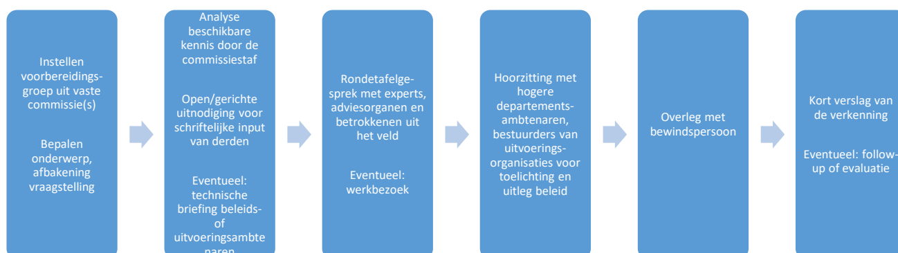
Figuur 2 Mogelijke opzet van een 'parlementaire verkenning'

Een verkenning leent zich met name wanneer er complexe vragen spelen over de uitvoering van nieuw of bestaand overheidsbeleid dat grote impact heeft op (groepen) burgers. De commissie kan dan - op basis van eigen onderzoek en met ondersteuning van de staf - de inzichten van deskundigen, belanghebbenden en betrokken ambtenaren in kaart te brengen aan de hand van gerichte onderzoeksvragen. Deze inzichten kunnen input vormen voor het overleg met de bewindspersoon.