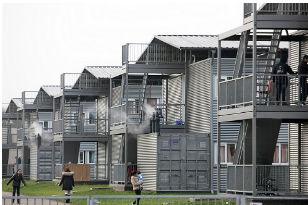
Afbeelding 11. Tijdelijke woonunits asielcomplex Ter Apel.

De Nederlandse overheid is verantwoordelijk voor de beschikbaarheid van veilige en leefbare opvang voor asielzoekers tijdens de asielprocedure. Tegelijkertijd is, gezien de schommelingen in de asielstromen, gebleken dat het plannen en realiseren van opvangcapaciteit complex is. Situaties van opbouw en afbouw van opvangcapaciteit kunnen elkaar snel opvolgen; soms zijn noodvoorzieningen aan de orde. De Inspectie onderzoekt daarom in hoeverre het Centraal Orgaan opvang Asielzoekers (COA) onder de geschetste omstandigheden in staat is een voor bewoners veilige opvang te realiseren. In het onderzoek is ook aandacht voor de veiligheid van medewerkers van het COA.