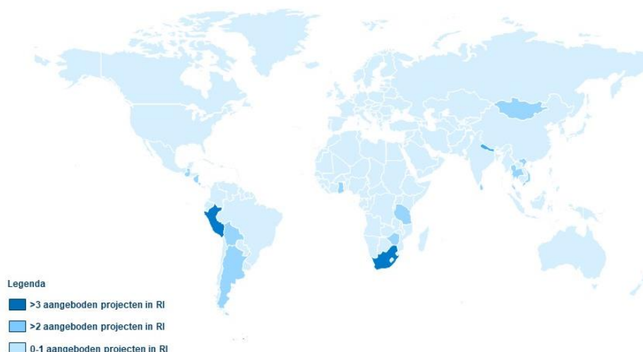
Figuur 5.1 Vrijwilligersprojecten in residentiële instellingen (RI) (overzicht van landen) (N = 15)

Dit beeld komt ook overeen met eerdere bevindingen uit het BCNN onderzoek. 176 Omdat er geen volledig beeld bestaat van de particuliere initiatieven, worden deze niet meegeteld in bovenstaande opsomming. Echter, anekdotisch bewijs toont dat deze projecten zich op min of meer dezelfde landen en regio's richten. Daarnaast zijn er voorbeelden van particuliere initiatieven (residentiële projecten) in Oost-Europa. De onderstaand figuur illustreert de bovenstaande data en is gebaseerd op de data die gevalideerd is met aanbiedende partijen. Er kan met zekerheid gesteld worden dat vanuit Nederland in ieder geval vrijwilligersreizen naar residentiële zorginstellingen in onderstaande landen worden aangeboden. De legenda toont dat zich in sommige landen (o.a. Peru) meerdere projecten in residentiële instellingen bevinden waarnaar reizen worden aangeboden. Mogelijk is de geografische spreiding van het aanbod van vrijwilligersreizen naar residentiële zorginstellingen voor kinderen breder dan onderstaande afbeelding weergeeft. Echter, dit kan op basis van dit onderzoek niet bevestigd worden. Kijkend naar de vergaarde gegevens van aanbieders kan wel geconcludeerd worden dat vrijwilligersreizen naar projecten met kinderen (niet louter residentiële zorginstellingen) veelal gericht zijn op Zuid-Amerika, Afrika en Zuidoost Azië.