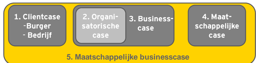
Figuur 1: maatschappelijke businesscase