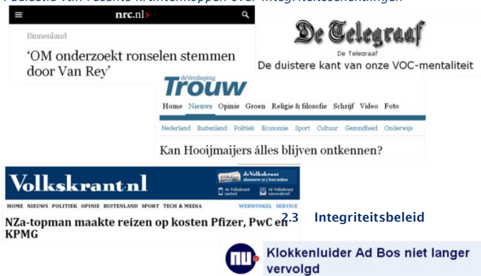
Figuur: Selectie van recente krantenkoppen over integriteitsschendingen

De media, en de sociale media in het bijzonder, hebben een belangrijke rol gespeeld in het agenderen van het onderwerp integriteit en in het stimuleren van deze kritische houding. De media richtten zich hierbij hoofdzakelijk op gevallen van (mogelijke) individuele integriteitsschendingen van bestuurders en politici. Deze spreken het meest tot de verbeelding. Daarnaast krijgen klokkenluiders veel aandacht. De bouwfraude-affaires en bestuurlijke problemen binnen woningcorporaties hebben de laatste jaren het publiek debat rondom fraude en integriteit beheerst. Deze media-aandacht heeft ook een negatieve kant. De media maakt van veel kwesties integriteitskwesties en beoordeelt gedrag en personen al snel als niet-integer. Ook deze ontwikkeling komt in het vervolg van deze rapportage uitgebreider aan bod.