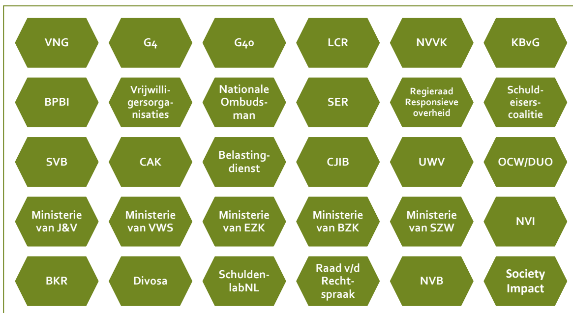
Figuur 2.2 Betrokken partijen in het Samenwerkingsverband Brede Schuldenaanpak

In dit samenwerkingsverband ontmoeten ministeries, gemeenten en andere soorten organisaties elkaar, waarbij zij elkaar informeren over verschillende initiatieven met betrekking tot de